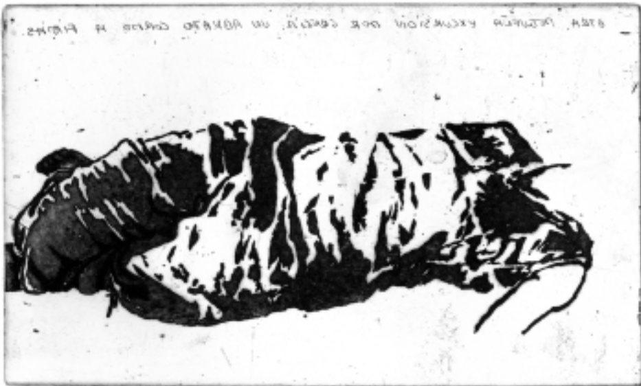
PEDRO CHILLIDA 2003