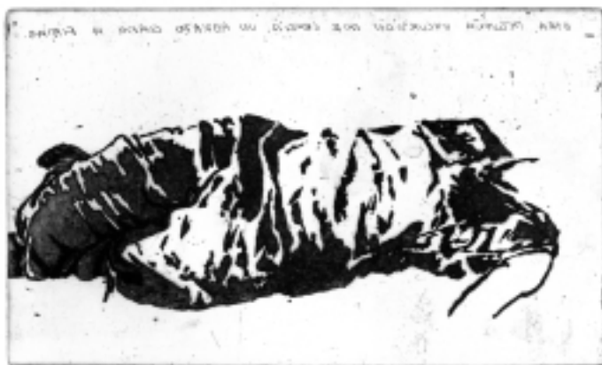
PEDRO CHILLIDA 2003