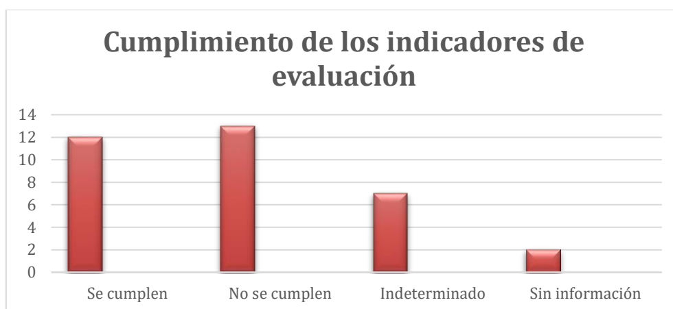
Tabla 9: Información sobre los indicadores de evaluación

- Revisar los indicadores de evaluación con el fin de contribuir a mejorarlos.