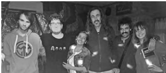
Membres del grup amb alguns dels assistents al concert