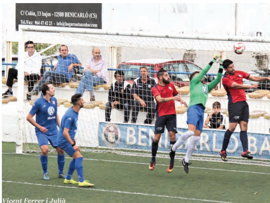
Tres pera una crònica

Total, que com anava dient, arriba el minut noranta i van ells i ens marquen un gol. Injust. Molt injust. Ells no