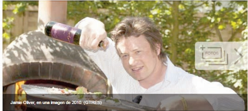
Jamie Oliver, en una imatge de 2010.