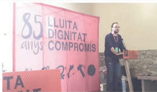
Imagen de la clausura del congreso de las juventudes de ERC