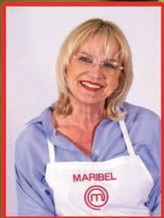
A. Un vanguardista ingredient culinari