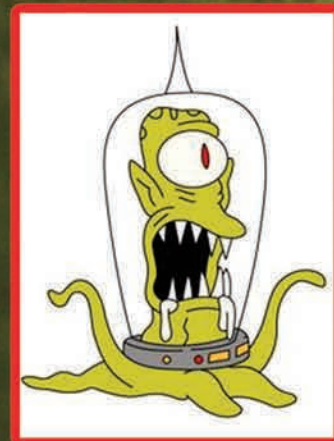
C. Un visitant de "La Llum de les imatges"