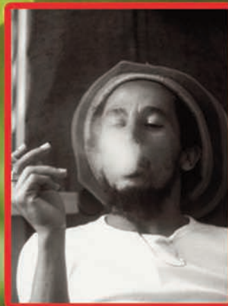
B. Un tradicional remei medicinal