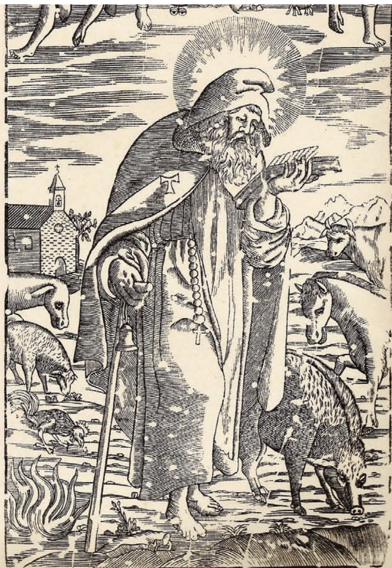
SANT ANTONI ABAT.

Contesteu, per caritat. Si vos també mos fallàveu, Qui mos podrà consolar! Recordeu els desgavells Que us contavem l'any passat? Doncs s'han quedat en no res Comparats amb els d'enguany. Lo que anava malament Encara s'ha empitjorat I les coses que rodaven Ja no van ni cara avall: Sense faena a les fàbriques, Una ruïna els bancals, Els jóvens cap a Alemanya I els vells ... que els tiren al mar! Mos volen tancar l'escola, I en quatre dies, qui sap Si no mos lleven, també, El metge i el practicant. Mil més que vos en diria D'abusos i destrellats. Mireu, només, per exemple, Com mos tenen informats: Les notícies de l'oratge, Si les volem escoltar, Mos les diuen de Madrid En perfecte castellà. Si ha plogut en Benissuera, A qui podria importar? Hay nieve en los Pirineos, I en Canarias, mala mar. Que visquen Messi i Ronaldo, Belen Esteban i, és clar, Visca Isabel, i Fernando, I el Espiritu Imperial. Imagineu la vergonya Que patim els valencians De sentir-nos forasters Sense tindre d'emigrar. Canal nou era una pena, Això no ho podem negar, Però, vist el que vegem, Ara el trobem a faltar. Volem l'Alqueria Blanca, Les músiques i el raspall, Les falles i les fogueres, ells moros i els cristians. Pel·lícules i notícies En llengua de valencians, La de Fuster i Estellés La de Corella i March. Volem ser honrats i dignes, I dur sempre el cap ben alt. Déu mos guard de forasters Que de casa mos trauran! Volem treball i justícia,