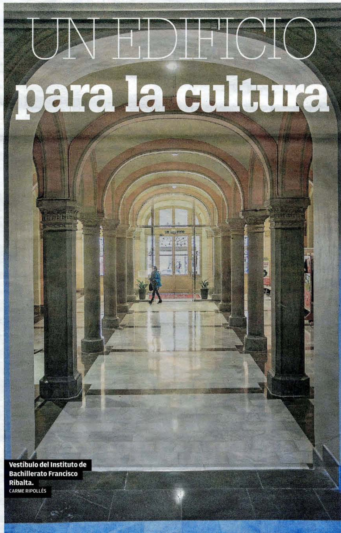
Vestíbulo del Instituto de Bachillerato Francisco Ribalta. CARMÉ RIPOLLÉS

Traver Tomás también firmó el Obelisco, el Hotel Suizo o la Casa de los Caracoles