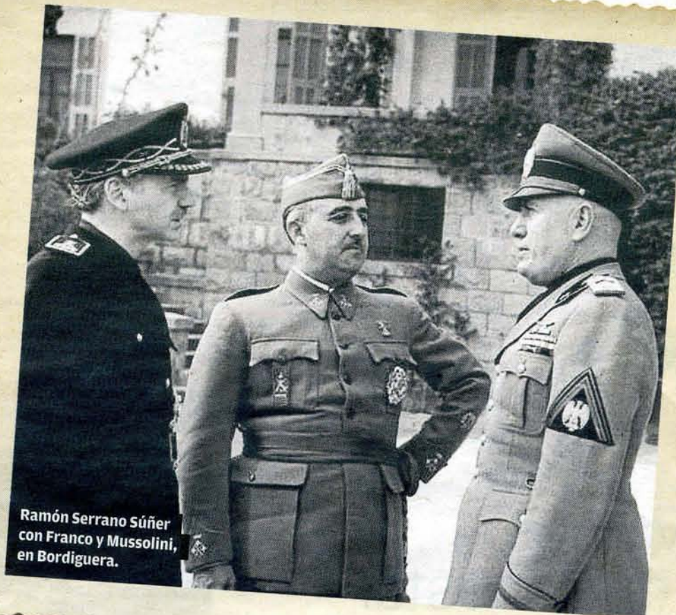
Ramón Serrano Súñer con Franco y Mussolini, en Bordiguera.

Ramón Serrano Súñer y Marcelino Domingo Sanjuán son dos estudiantes que coincidieron un curso en el Instituto Ribalta. Eso sí, con trayectorias políticas distintas en un contexto de confrontación ideológica: el primero pertenecía a Falange Española, mientras que el segundo siempre militó en partidos republicanos.