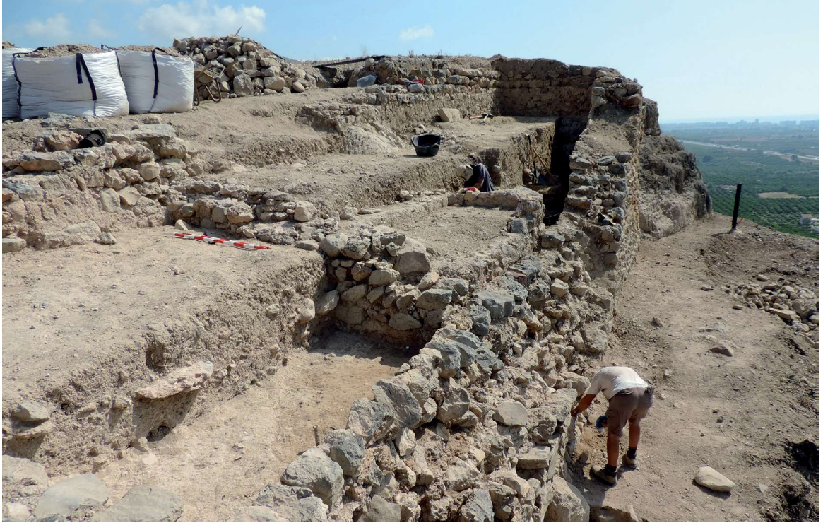
Figura 2. Excavacions arqueològiques a l'alcassaba del Castell Vell. Any 2015.

Els estudis més recents que s'estan duent al castell aporten dades noves i singulars sobre la història de l'emplaçament. No debades, la imatge que ofereix hui el castell i la que oferirà en els propers anys és radicalment diferent d'aquella visió que tothom guarda encara al seu subconscient, perquè és fruit de molts i molts anys de veure'l de la mateixa forma. Aprofitem ara i, si comença a canviar la perspectiva visual del castell arran dels treballs arqueològics