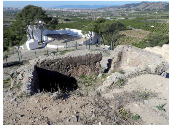
Figura 9. Estructures del castell que han canviat d'ús.

b) Relacionar els models de castells amb els tipus de societats. La presència de castells que dibuixen línies horitzontals en el paisatge, front a d'altres posteriors on predomina la verticalitat, que disposen de grans recintes i estan estructurats en parts