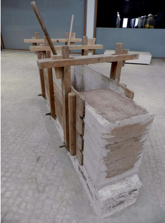
Figura 4. Model a escala de com es construïa la tàpia del Castell Vell.

algunes de les dificultats i dels obstacles inherents que l'acompanyen. En primer lloc, estan aquelles vinculades al valor social que, encara hui i de forma generalitzada, és atribuït al patrimoni i que es poden sintetitzar ací en els punts següents: