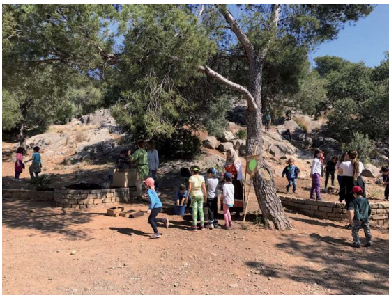
Figura 6. Activitats didàctiques escolars a l'emplaçament del Castell Vell.

-Una didàctica que ha de servir per a aprendre continguts, destreses i valors. Però la didàctica del patrimoni permet