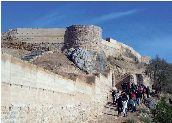
Figura 10. Visita guiada al Castell Vell a l'any 2017.

d) Conèixer les parts i els espais del castell. Saber les parts en què s'estructura el castell i com es relacionen entre elles permet dissenyar activitats i estratègies didàctiques d'apropament que es desenvolupen allí mateix, de forma contextualitzada (figura 10). Conèixer l'alcassaba, l'albacar amb magatzems i aljubs, o la madina amb les cases, mitjançant un procés d'interrogació constant pot acostar-nos a esbrinar com era el dia a dia del castell, la vida quotidiana dins i fora dels murs de defensa. Com eren els espais de les cases i les activitats que