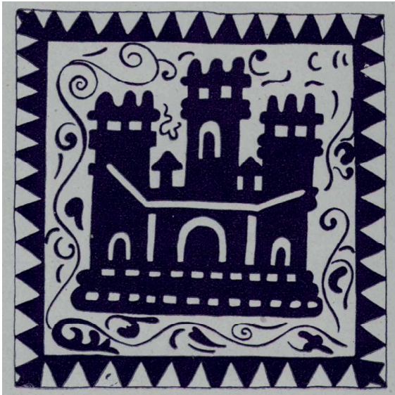
Figura 8. Icona de castell en un taulell del segle XV.

i aprenentatge, tot aprofitant la seua capacitat per motivar i evocar processos del passat en l'alumnat, en la línia ja apuntada per altres treballs (Cuenca, 2007). El castell es pot estudiar des de múltiples punts de vista, i tots ells fan referència a diversos continguts que poden esdevenir rellevants a l'hora de treballar les ciències socials. L'objectiu principal d'estudi no pot ser el castell com a edificació solament. Este ha de ser l'excusa per parlar d'altres aspectes més amplis i globals, doncs es tracta d'un referent privilegiat del territori i del poblament. Centrar l'atenció només en el monument pot fer oblidar la raó de ser del propi castell.