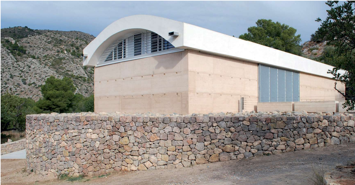
Figura 5. Centre d'interpretació del Castell Vell.

centrada en el procés d'ensenyament i aprenentatge, i vetlla per les metodologies i els recursos pràctics que es posen al servei del referit procés. La didàctica es mou, doncs, en els àmbits educatius i formatius i té com a referents les directrius pedagògiques.