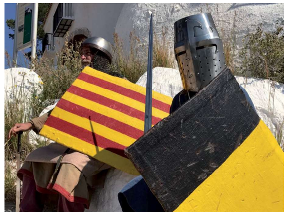
Figura 7. Activitats dramatitzades per a escolars al Castell Vell.