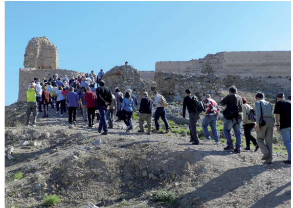
Figura 3. Visita guiada al Castell Vell a l'any 2016.

Es pot arribar a fer una visita molt tècnica del castell (figura 3), molt farcida d'informació precisa, però la pregunta continuarà sent la mateixa, què en treu la gent al final? Hem de tindre la capacitat de generar un sentiment volgut, una percepció que allò és propi, que té un significat i que en forma part de la seua història. En cas contrari es farà una visita rutinària i, molt probablement, una vegada feta no es tornarà mai més. La forma d'afrontar el treball amb el patrimoni canvia si es fa des de la perspectiva de les restes materials tal qual són, o si es fa des de les històries viscudes i reflectides a cadascun dels indrets i racons que configuren les restes, i les quals cal anar descobrint. El patrimoni conté missatges de les cultures del passat, explica coses dels moments històrics que visqué i ho fa d'una forma objectiva. La història evidenciada a