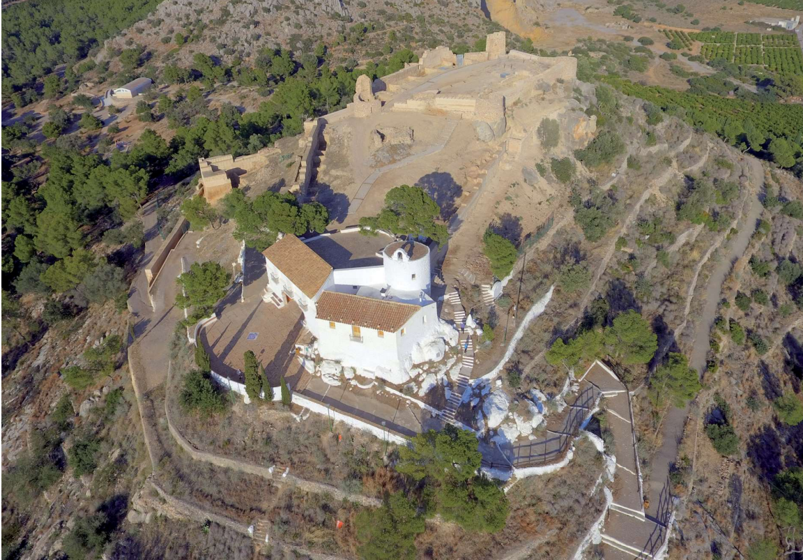
Figura 1. El Castell Vell en gener de 2018.

concret, l'esdevenir de les societats que s'han succeït al llarg dels segles, amb les seues pervivències però també els seus canvis, amb continuïtats i ruptures, que tot plegat resulten bàsiques per treballar la noció de temps, del seu pas i, per tant, resulta molt útil per afrontar el temps històric als cicles de primària i millorar la seua comprensió a l'ESO i el Batxillerat. I, a més