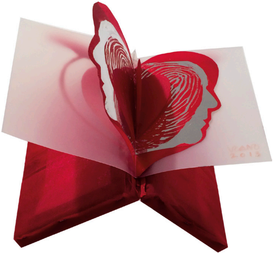
Libro volador rojo , 2013. Mixta / lienzo, madera, acetatos, 20 x 30 x 40 cm