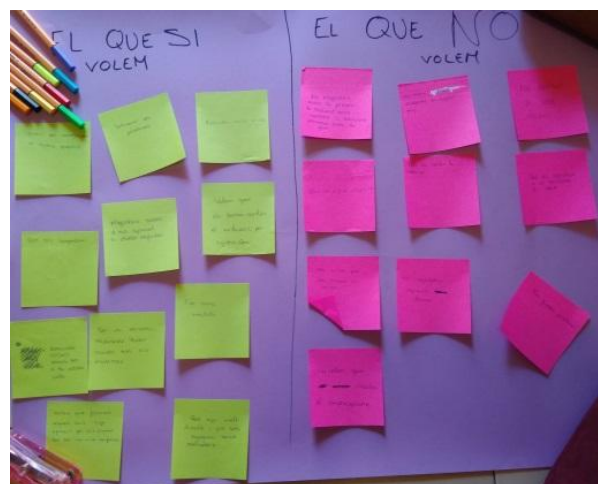
Ilustración 1. Los dos carteles

Actividad: "Los dos Carteles" (20') (documento 1.2 Torrego 2017:25) cada alumno escribe en dos post-its aquello que quieren que ocurra y lo que no en el programa. Después cada alumno/a lee en voz alta sus post-its y los coloca en dos cartulinas (Ver ilustración 1).