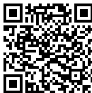
Código QR 1. Vídeo y fotos de las jornadas de Benicàssim

Se puede consultar el programa de la Jornada de Benicàssim en el código QR 4. En estas jornadas el alumnado participó muy activamente en todas las actividades propuestas. Desde el CONTA'M, en el que dos alumnas explicaron el programa de mediación del centro, el pasapalabra en el que un alumno explicó el motivo de ser mediador, hasta en los diversos talleres que propusieron. Uno de los talleres consistió en la importancia de la educación emocional en la resolución de conflictos. El taller fue realizado por una psicopedagoga que pertenece a una asociación local llamada "La Maraña" que colaboró con las jornadas aportando personal especializado y el espacio en el que se llevó a cabo el taller. Las imágenes y vídeos de la jornada se pueden ver el código QR 1 y el programa de las jornadas de Benicàssim en el código QR 2.