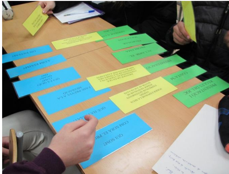
Ilustración 2. Fases de la Mediación

Explicación: Fases de la Mediación (Torrego 2017:62-63), para ello se ha elaborado un documento de presentación.