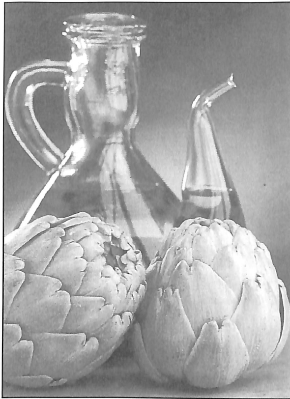
Las alcachofas serán, lógicamente, grandes protagonistas en estas jornadas gastronómicas.

"Al ser la primera vez que se pone en marcha esta iniciativa algunos restaurantes no se han animado, por lo que sólo participamos siete. Pero el año que viene ya seremos más. Así ha pasado con la Demostración Gastronómica de mañana,