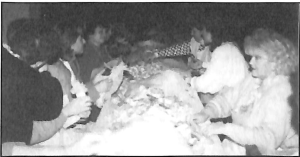
Más de 115.000 cocas han sido envueltas para la fiesta de Sant Antoni.