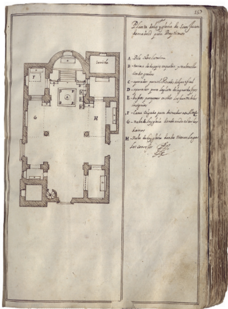
Fig. 2. Juan Gómez de Mora, Planta de la iglesia de San Juan para los Bautismos , 1651, AGP, Planos 4099.

ricas para poner en ellos las fuentes de las seis insignias. En el lado de la epístola sobre otro aparador descansaban más piezas de plata para el servicio de ese día, así como una cama colgada o con cortinas para desnudar al príncipe o infante, además de la cama sin cortinas bajo la que se situaba la pila en la parte central de la capilla.