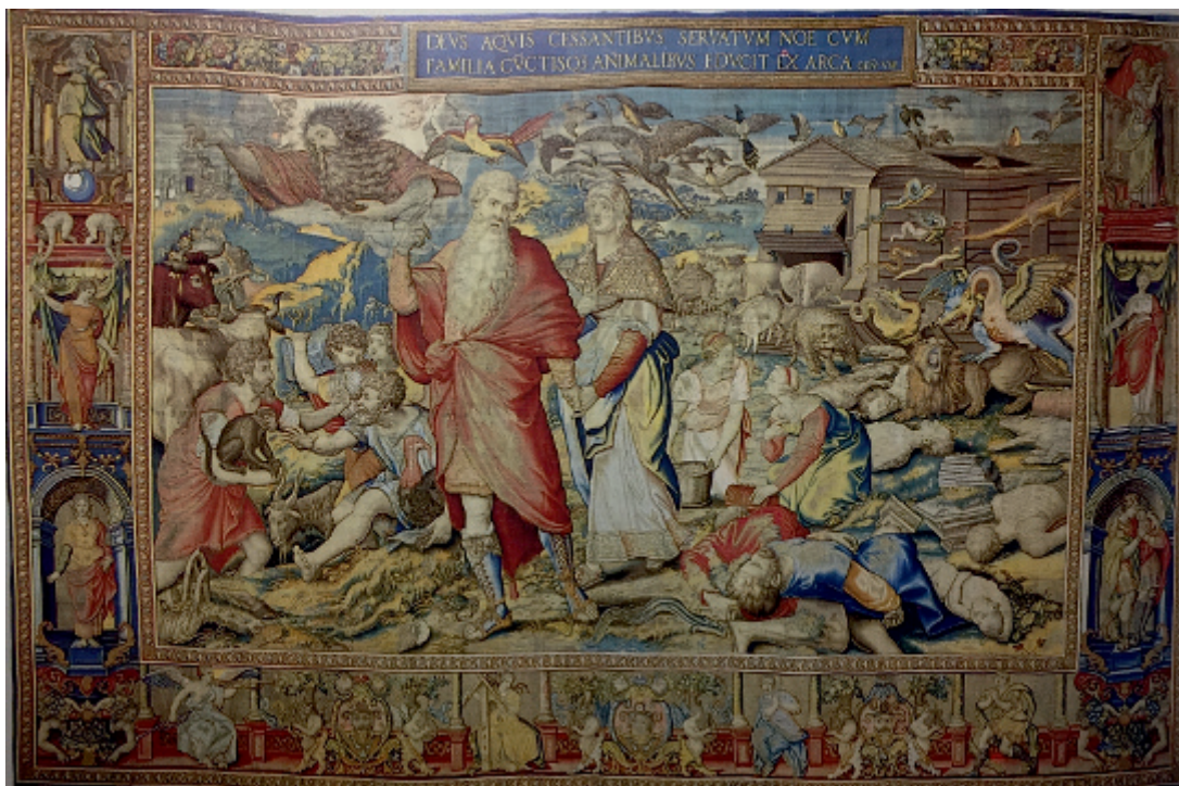
Fig. 8. La historia de Noé , paño III, Wilhelm de Pannemaker, 1563 y 1566. Patrimonio Nacional, Madrid.

cipio de su reinado, en su segundo viaje por los países del Norte, que se perdió casi en su totalidad en el viaje de envío a excepción de dos paños y que sustituida enseguida por otra, 54 fue utilizada habitualmente para decorar la Capilla Real y lució en los bautizos de la infanta María, hija de Felipe II, de la infanta María Eugenia y de la infanta María Teresa, hijas de Felipe IV, en 1626 y 1638, y de Carlos II en 1661.