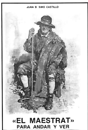
Portada del libro "El Maestrat. Para andar y ver". Sin duda alguna, uno de los mejores que se han publicado sobre nuestra maravillosa comarca.

Nos habla de las pinturas rupestres halladas en los barrancos de la Valltorta (Tirig-Albocacer-Cuevas de Vinromá) y de la Gasulla (Ares del Mestre), en Chert y Benasal. De los poblados ibéricos de Benicarló y Vinaròs, de las presencia de fenicios, griegos y romanos, de la Vía Augusta.