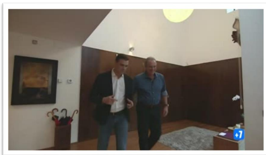
Fuente: Programa En la tuya o en la mía con Pedro Sánchez TVE

- La llegada del entrevistado a la casa de Bertín, en otros programas es al contrario y es Osborne quien es el invitado en la casa del entrevistado.