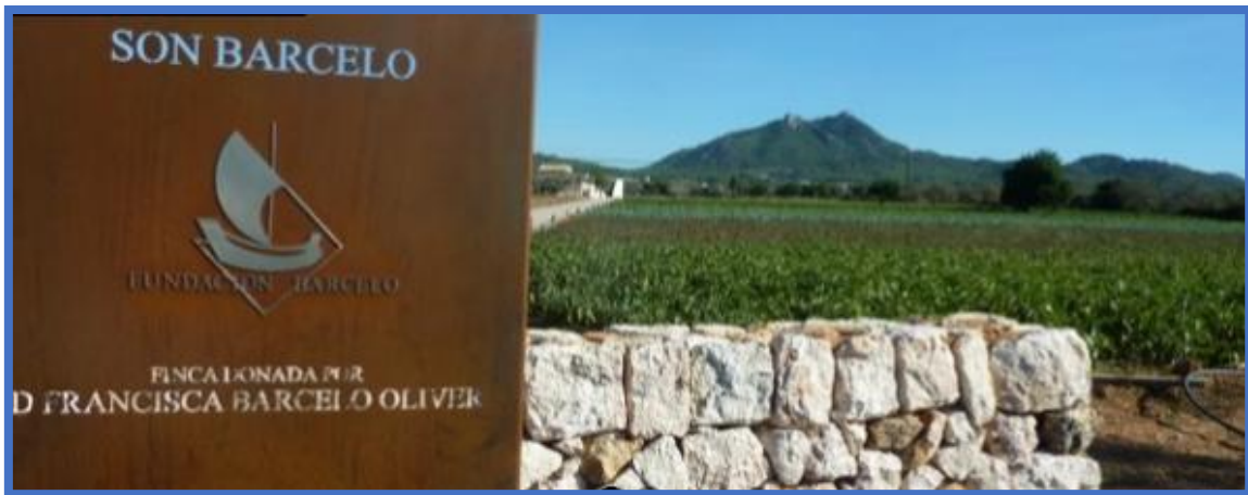
Imagen 8, finca para la colecta de alimentos, página web Fundación Barceló: http://fundacionbarcelo.org/