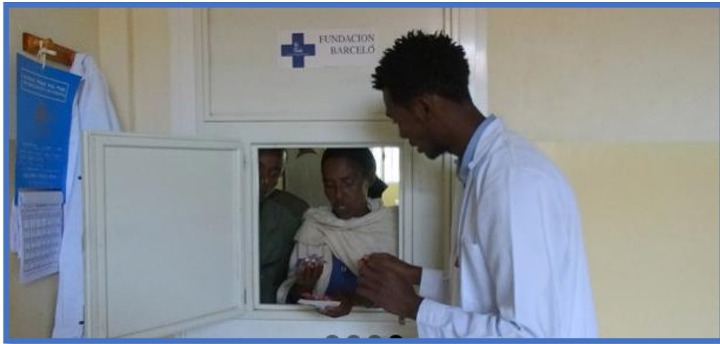
Imagen 2, Programa FARMASOL, página web Fundación Barceló: http://fundacionbarcelo.org/ .

Con este programa lo que quieren conseguir es que las personas desfavorecidas tengan medicinas y toda la información sobre como tomarlas, de manera responsable mejorando así la salud y su calidad de vida. Para ello se encargan primeramente de formar al personal que se encargará de suministrarles las medicinas y de darles charlas educativas de las mismas.