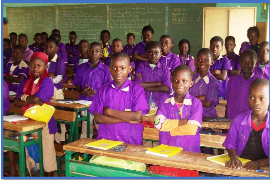
Imagen 4, página web Fundación Barceló: http://fundacionbarcelo.org/

Algunos de los proyectos realizados por la Fundación en cuanto al ámbito educativo durante el último año 2017 se pueden ver reflejados en la siguiente tabla.