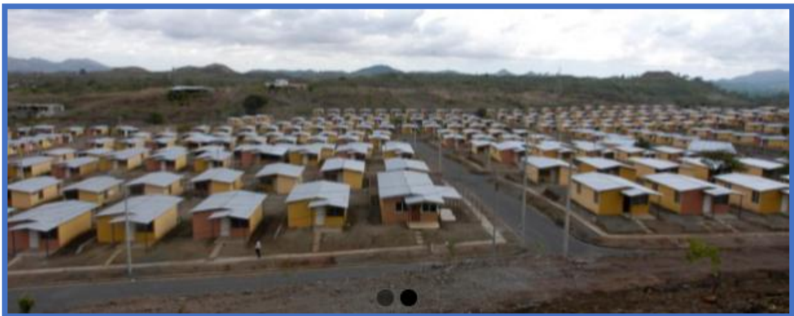
Imagen 7, construcción de viviendas, página web Fundación Barceló: http://fundacionbarcelo.org/

“El proyecto incluye la urbanización del terreno, la pavimentación de las calles, iluminación pública, dotación de agua potable y depuradora de aguas residuales, para facilitar todos los servicios a los usuarios, etc. La urbanización cuenta además con un parque, una guardería y un supermercado que mejoran la calidad de vida de los habitantes del residencial.”