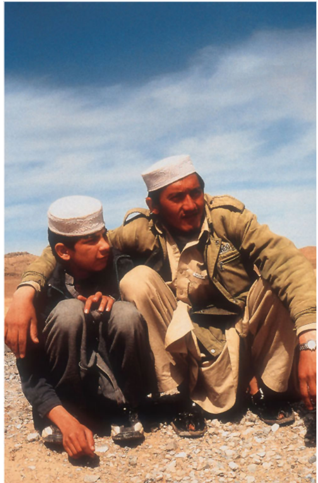
In this World (2002) de Michael Winterbottom