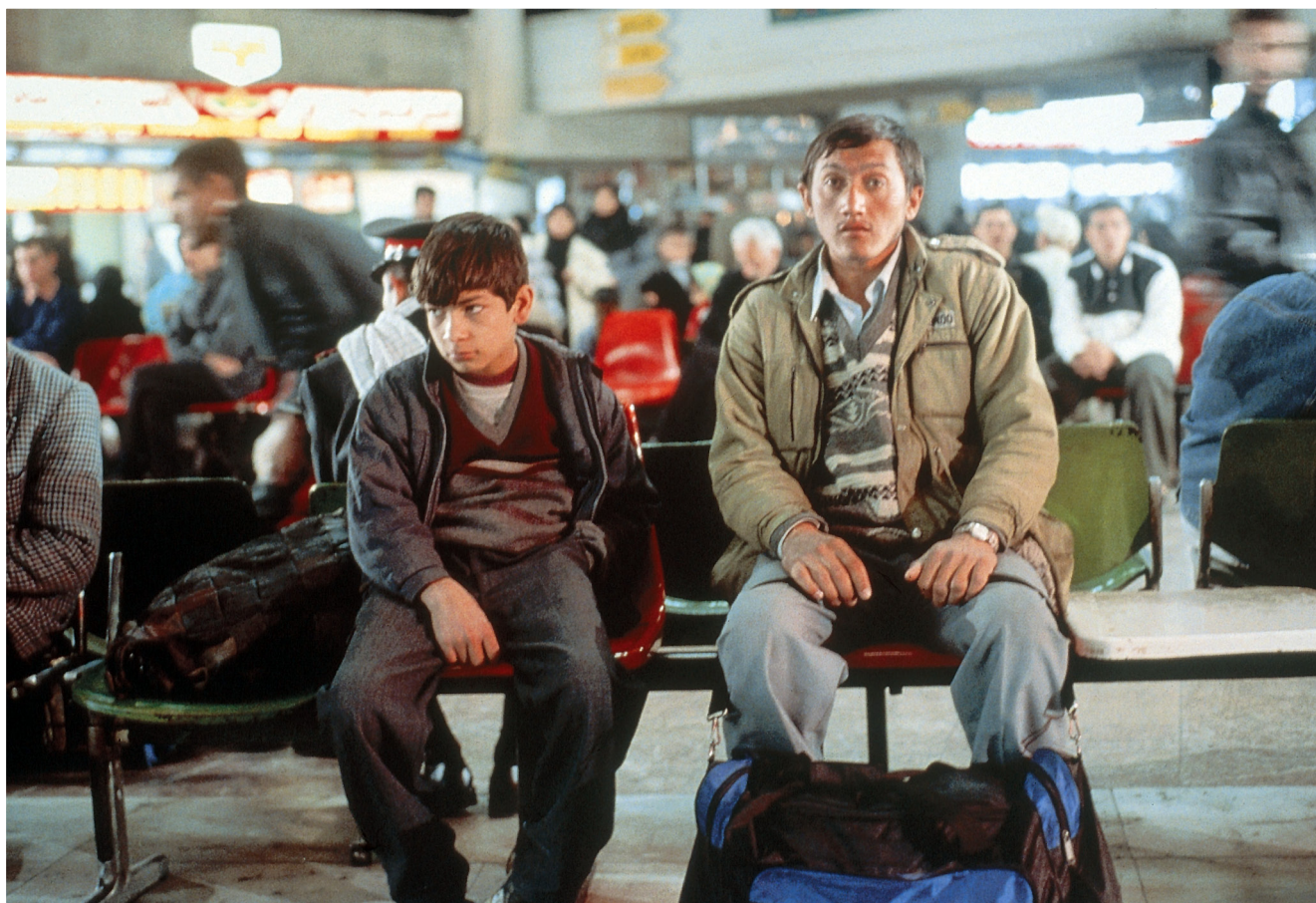
In this World (2002) de Michael Winterbottom