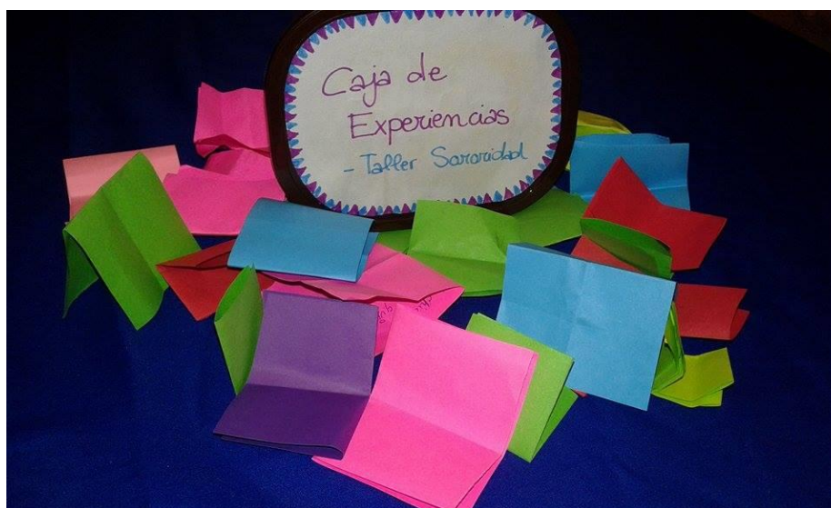
Ilustración 2. Actividad Caja de experiencias

Evaluamos la actividad muy positivamente. Al principio han tenido dificultades para pensar en situaciones pero después de unos sencillos ejemplos se han expresado. Más aún, algunas de ellas se han visto removidas emocionalmente con la actividad, al tomar conciencia de las diferentes situaciones que han vivido.