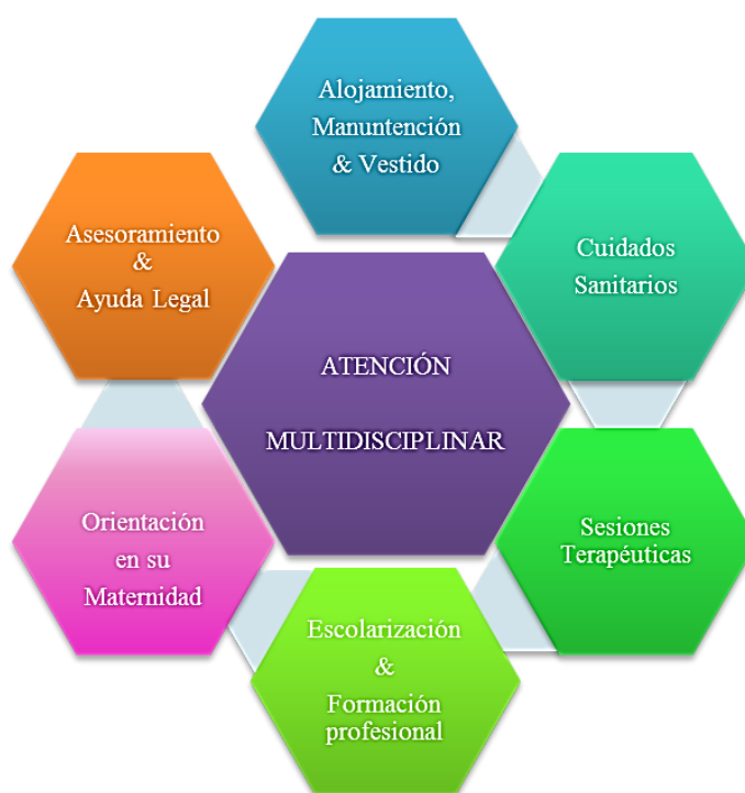
Figura I. Representación gráfica de la atención multidisciplinaria que reciben las usuarias en Mantay.

La atención multidisciplinaria que reciben las usuarias se puede resumir con la siguiente ilustración (Figura I):