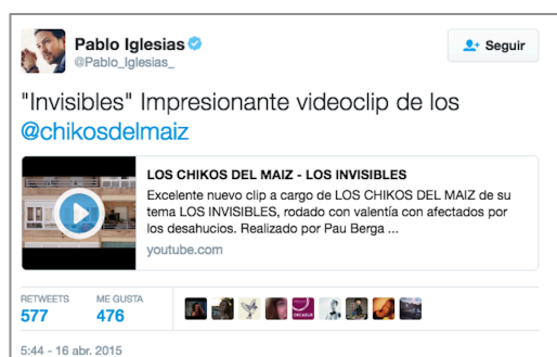
Imagen 1. Tuit de carácter personal publicado por Pablo Iglesias