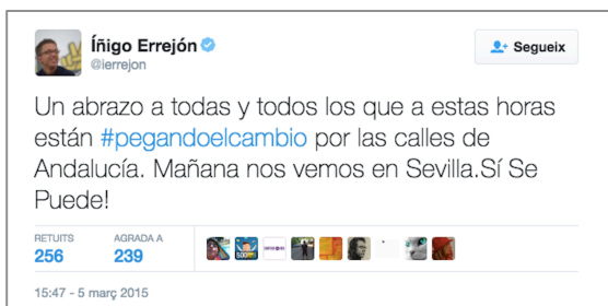
Imagen 2. Tuit de temática electoral de Íñigo Errejón