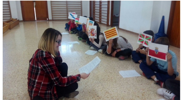
Ilustración 8: repasando diálogos con las banderas ya hechas.