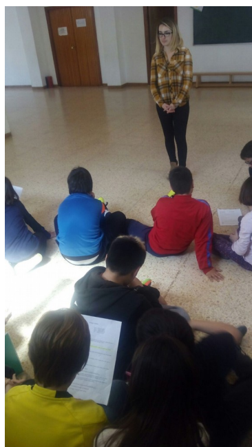
Ilustración 3: repasando el guion