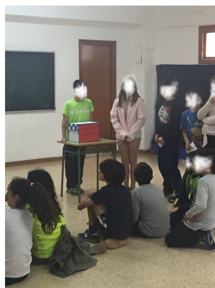
Ilustración 4: última escena votando