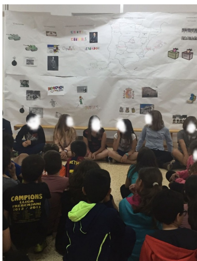
Ilustración 1: segunda escena: la constitución