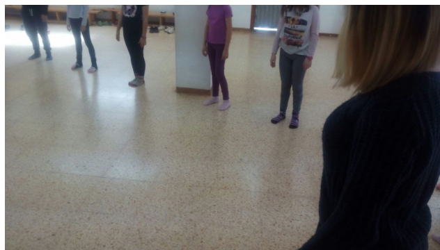
Ilustración 4: estiramientos antes de la sesión práctica