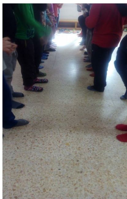
Ilustración 5: actividad de imitación del compañero