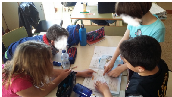
Ilustración 1: preparando la parte teórica