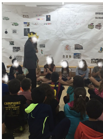
Ilustración 2: segunda escena donde aparecen los reyes de España