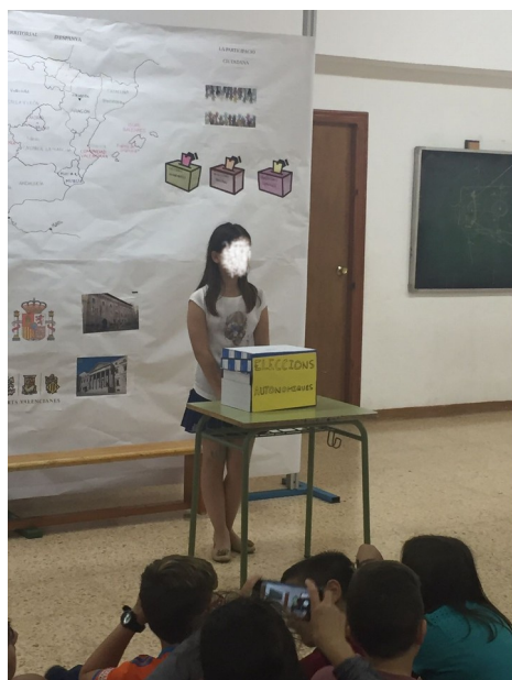
Ilustración 3: mesa de elecciones, última escena