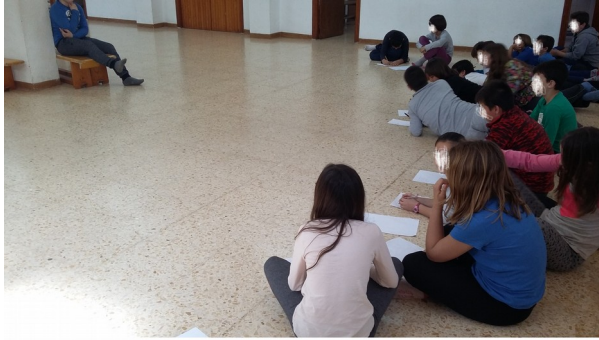
Ilustración 7: Primera vez que sale de voluntario el alumno con Trastorno de la Comunicación Social