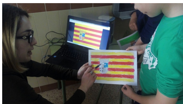
Ilustración 6: pintando las banderas para una escena