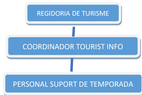
figura 4: Organigrama actual del departament de turisme Ajunt. Benicarló. Elaboració Propia

La realitat es que l'actual departament de turisme manca d'una estructura organitzativa, el que dificulta la realització d'accions i estratègies relacionades amb el sector.