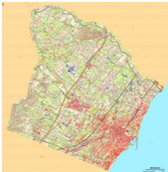
figura 1: mapa del terme municipal amb els usos del sòl, (Argos 2016)

Pel que fa a l' ús del sòl , cal destacar que Benicarló té únicament el 8,38% de sòl urbà, predominant el sòl rústic i agrari amb el 80% dedicat a conreus herbacis i llenyosos, molt per sobre de la mitjana comarcal. La superfície forestal és molt residual. (ARGOS 2016).