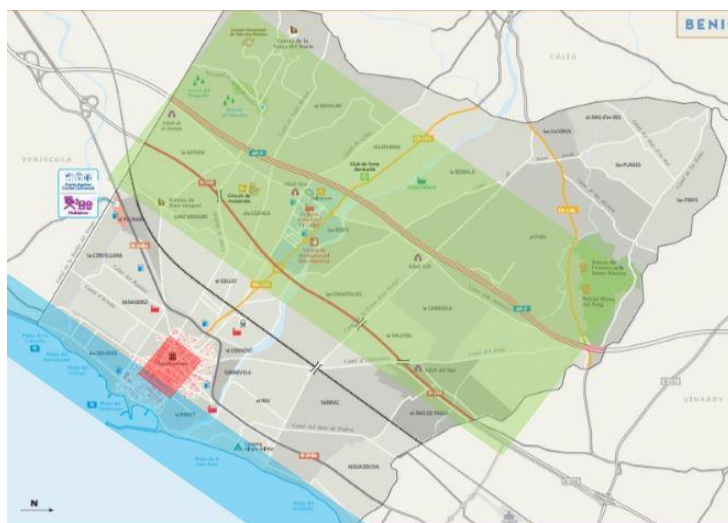
figura 3: Plànol d'ubicació de les UATs