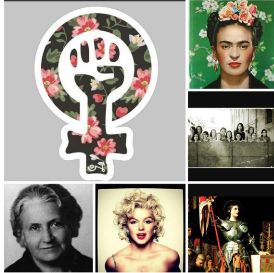
Imagen de la actividad: