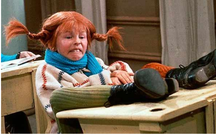
Imagen de la actividad: