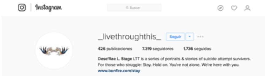
Figura 3. Captura de pantalla de la página de Instagram de _livethroughthis_

En esta misma línea de animar, dar visibilidad y conectar a quienes sufren los mismos problemas de salud mental, podría incluirse la página de Instagram de _livethroughthis_ que se presenta como: «Dese'Rae L. Stage LTT is a series of portraits & stories of suicide attempt survivors. For those who struggle: Stay. Hold on. You're not alone. We're here with you. www.bonfire.com/stay »(Figura 3)