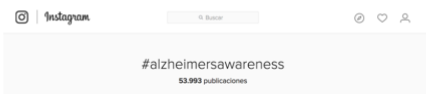
Figura 4. Captura de pantalla de la búsqueda de #alzheimersawareness en Instagram el 01/10/2016.

Por cuestiones éticas y de respeto al anonimato de otros usuarios particulares que tienen perfiles en esta red social y comparten en ella imágenes relacionadas con sus tratamientos o diagnósticos, sólo se mencionan estos perfiles que son colectivos y que tienen en su origen ya la intencionalidad de dar difusión a este tipo de temas. Sin embargo, se considera que ilustran estas nuevas prácticas que están surgiendo online y de las que se ha hablado previamente (Pardo y Morcate, 2016): la necesidad de conectarse, de crear comunidades y en muchas ocasiones de crear sensaciones de co-presencia. Como datos generales en apoyo de esas nuevas prácticas fotográficas en las redes sociales a favor de un cambio de representación desestigmatizante de las enfermedades mentales, pueden mencionarse las 53.993 imágenes publicadas bajo la etiqueta #alzheimersawareness (Figura 4) que mayoritariamente recogen momentos de encuentros, alegres y muy coloristas.