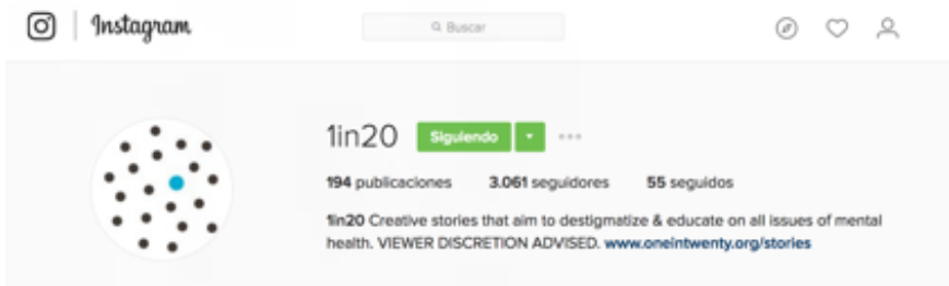
Figura 1. Captura de pantalla del encabezamiento de 1in20 en Instagram.

Uno de los casos de estudio más interesantes en este contexto es el del proyecto 1in20 15 que en la presentación de su página/perfil de Instagram hace ya toda una declaración de intenciones: «1in20 Creative stories that aim to destigmatize & educate on all issues of mental health. VIEWER DISCRETION ADVISED. www.oneintwenty.org/stories » (Figura 1).