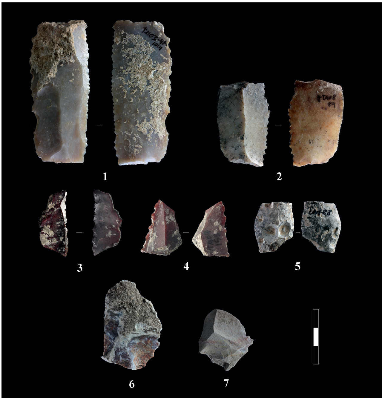
Figura 9.2. Indústria lítica tallada del Mortòrum. 1-4 Dents de falç; 5 Fragment de punta foliàcia; 6-7 Ascles.