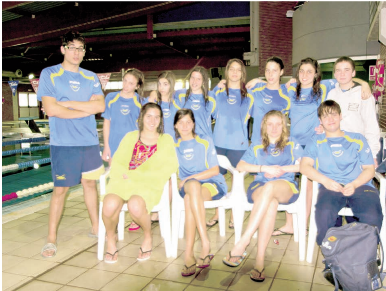
Els nedadors i nedadores del Club Natació Benicarló van calfar motors a la vista del pròxim Campionat Autonòmic d'Hivern.

I la pròxima setmana a Sagunt (València) on els nostres nedadors i nedadores competiran al II Campionat Autonòmic Aleví d'Hivern.