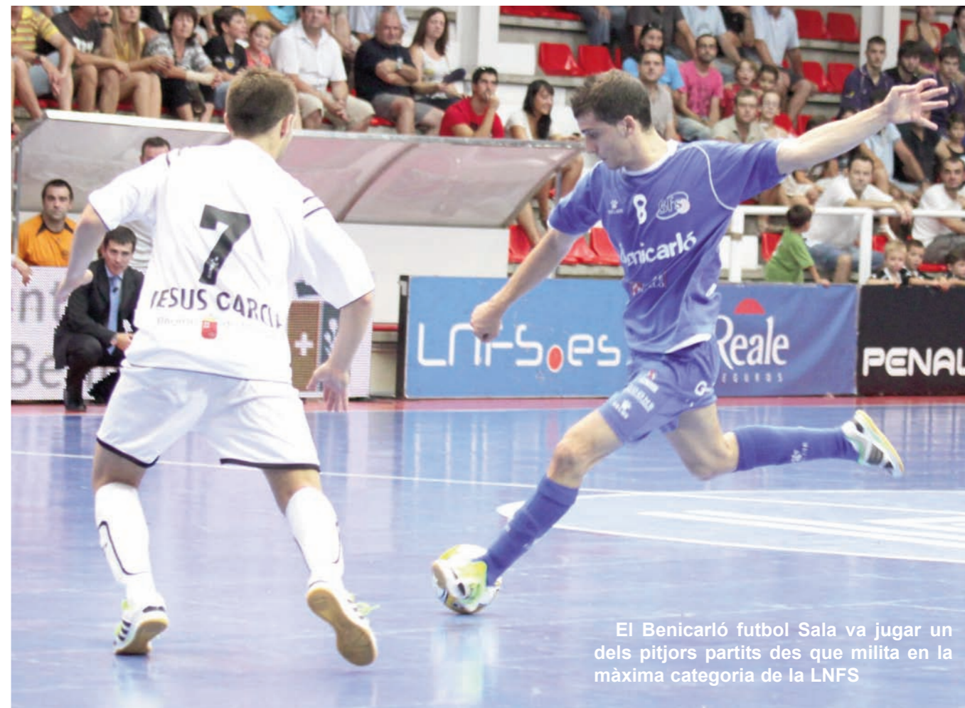
El Benicarló futbol Sala va jugar un dels pitjors partits des que milita en la màxima categoria de la LNFS