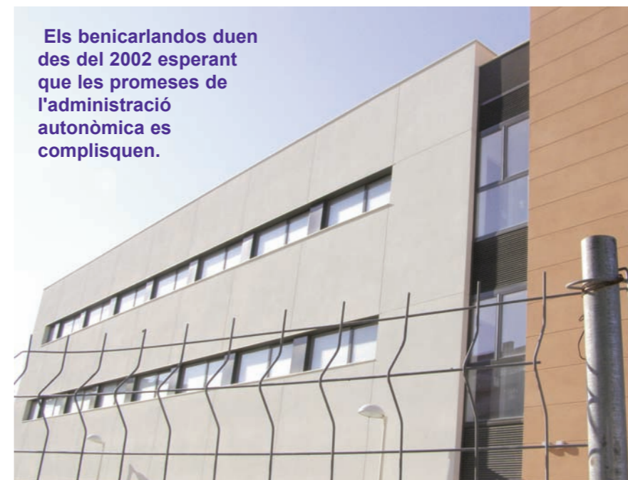
Els benicarlandos duen des del 2002 esperant que les promeses de l'administració autonòmica es complisquen.

I un altre fet porta de cap als usuaris del centre de salut. En Benicarló, dels sis metges que atenen el departament de Pediatria, només tres són titulats en la matèria. La situació, a més, no és del tot normal. Dues doctores titulades cobreixen de forma continuada l'atenció als menors. La tercera plaça està ocupada per un metge titular que només passa consulta dos dies a la setmana, ja que els tres restants exerceix de psiquiatra infantil en l'Hospital Comarcal de Vinaròs. Així les coses aqueixos tres dies es cobreixen a Benicarló amb metges no titulats en Pediatria, que es van alternant per a atendre la demanda existent d'aquest professional. La situació a Benicarló, segons conselleria, també s'espera que es normalitze una vegada entre un funcionament el nou CSI del carrer de Boters.