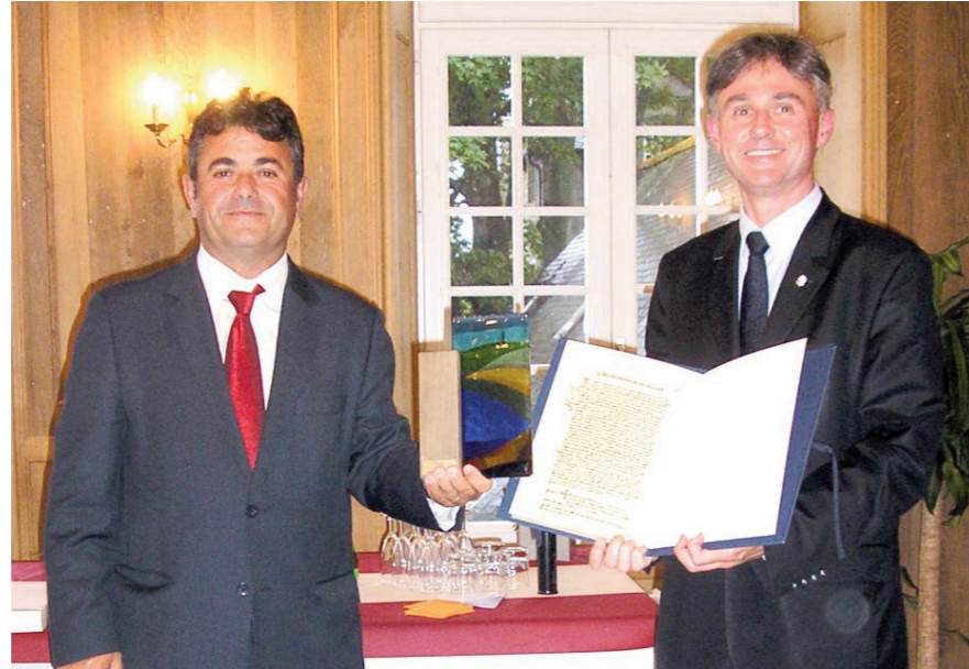
La visita a Saint-Pol-de-Léon ha reforçat les relacions institucionals entre les dos ciutats