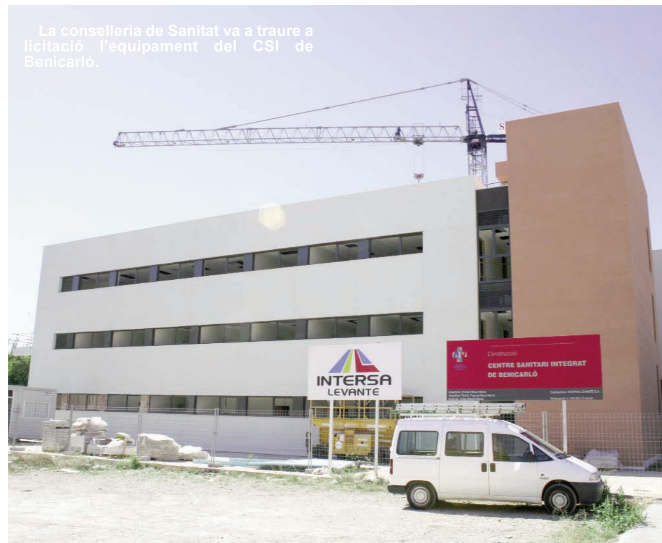
La conselleria de Sanitat va a traure a licitació l'equipament del CSI de Benicarló.