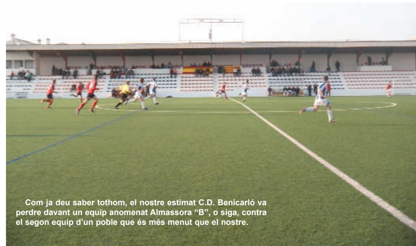
Com ja deu saber tothom, el nostre estimat C.D. Benicarló va perdre davant un equip anomenat Almassora "B", o siga, contra el segon equip d'un poble que és més menut que el nostre.

Però totes aquestes notícies que no són gens bones per al nostre equip, queden en no res si ens posem a pensar en allò que realment ens interessa a tots i que omple les nostres ànimes de joia i felicitat. Efectivament, l'olor a pólvora ja penetra a les nostres cases deixant aquest aroma festiu i tan nostre. Ara només ens queda esperar la grandiosa setmana fallera, amb els carrers tallats, l'olor d'orins per tots els racons del poble i els simpàtics xiquets posant els coets per allà on els surt de la plata dels peus. Aii Quina meravella.