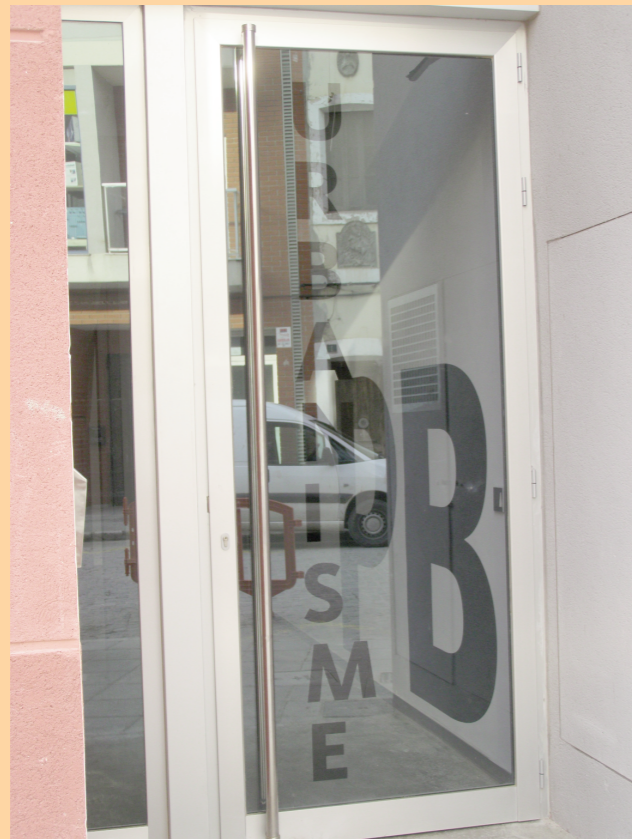
"URBANISME"... i el "medi ambient, on és?"

la policia del Papa i l'Alonso eixe i... dos plantes per a ell. No cal dir que ací els que tenen bigot pinten... i molt. Apa, el faraó ja ha estat investit amb el seu territori independent. Ja voldrien molts independentistes tenir-lo al seu costat. I és que allà per on passa deixa petjada. Independència!