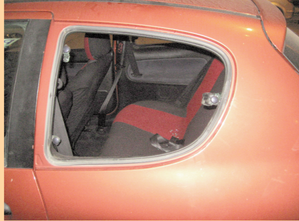
Robatori a l'interior d'un turisme estacionat a l'Avinguda Méndez Núñez.

L'oposició ja no recorda que el PP ens havia de garantir una seguretat, una tranquil·litat en els comerços fins al punt que gairebé un municipal ens duria la bossa de la compra a casa.