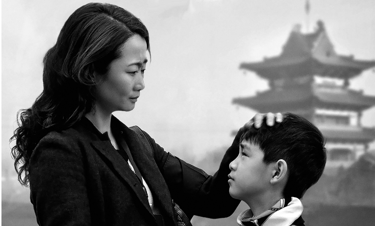
Más allá de las montañas (Shan-he-gu-ren, Jia Zhanke, 2015)