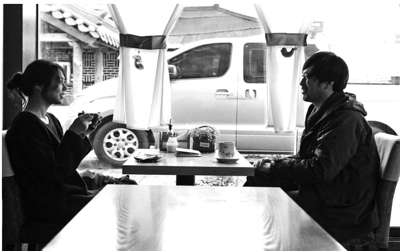
Ahora sí, antes no (Ji-geum-eun-mat-go-geu-dda-neun-teul-li-da, Hong Sang-soo, 2015)