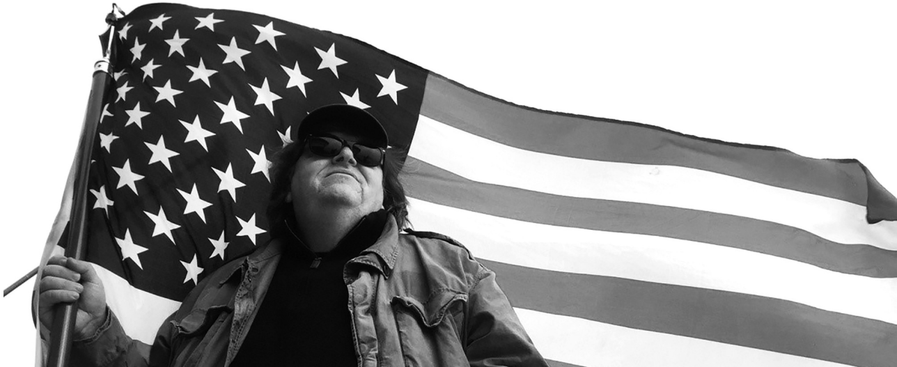
¿Qué invadimos ahora? (Where to Invade Next, Michael Moore, 2015),

el rescate de “bondades” de los sistemas políticos y sociales europeos para intentar aplicarlos en Estados Unidos, desvelando las carencias de su entorno. Así, ese personaje fofo y envejecido que interpreta el propio Moore (no podemos evitar sentir un poco de lástima por él) recorre el mundo para buscar aquello que funciona y contraponerlo a lo que no funciona en su propio país: educación, cultura, democracia, bienestar social, etc. Visto como un producto de consumo interno, es aceptable que cierre el círculo con una loa a los padres de la patria yanqui y a todos aquellos que ya “inventaron” antes que los europeos esas conquistas del bienestar (por cierto que en ningún momento se aclara que los avances costaron luchas, sangre, sudor y lágrimas), se vieron relegados en su propio país y ahora surgen como grandes logros en la exótica Europa (esto, a todas luces maniqueo, solamente se sostiene desde ese punto de vista interno-yanqui: hemos perdido nuestros horizontes y el bienestar de nuestra sociedad en tanto otros nos han copiado y lo están haciendo a la perfección).