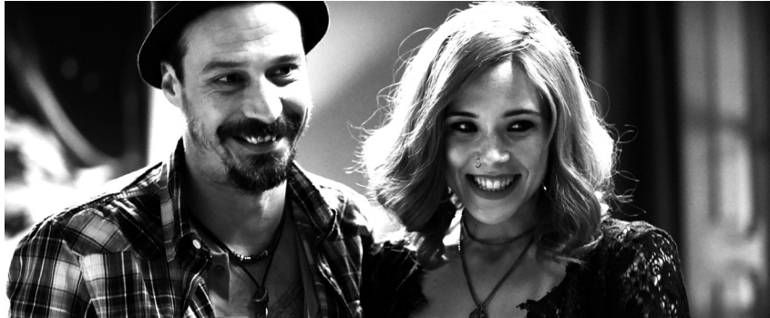
La noche que mi madre mató a mi padre (Inés París, 2016)