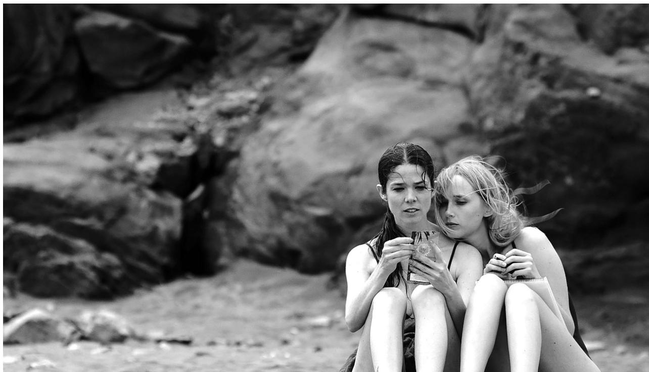
Acantilado (Helena Taberna, 2016)

La secuencia precréditos de Acantilado muestra el ritual que, al ocaso, practican los miembros de una secta, antes de perpetrar suicidio colectivo arrojándose por un desfiladero en la isla de Gran Canaria. Sin necesidad de recurrir a la palabra, y apoyándose en una excelente fotografía de Javier Agirre (una de las escasas virtudes que se mantendrán hasta el final), que se alía con los fanáticos para que el brillo del sol poniente en las túnicas blancas produzca un efecto mágico, la intriga se plantea subterráneamente recorrida por un cuestionamiento nada simplista ni complaciente del poder de