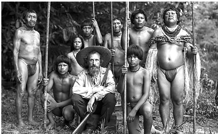
El abrazo de la serpiente (Ciro Guerra, 2015)

(algo interesante para los cines del yo). La estonia Eesti Risttuules (Martti Helde, 2014) plantea un momento duro de su historia (la deportación de ciudadanos durante la ocupación soviética). Su mejor aportación, de carácter estético, consiste en el juego con la imagen estática en blanco y negro sobre cuyos elementos la cámara busca en largos planos secuencia en los que se producen saltos temporales; en ocasiones la imagen cobra movimiento total o parcial, y el sonido, al