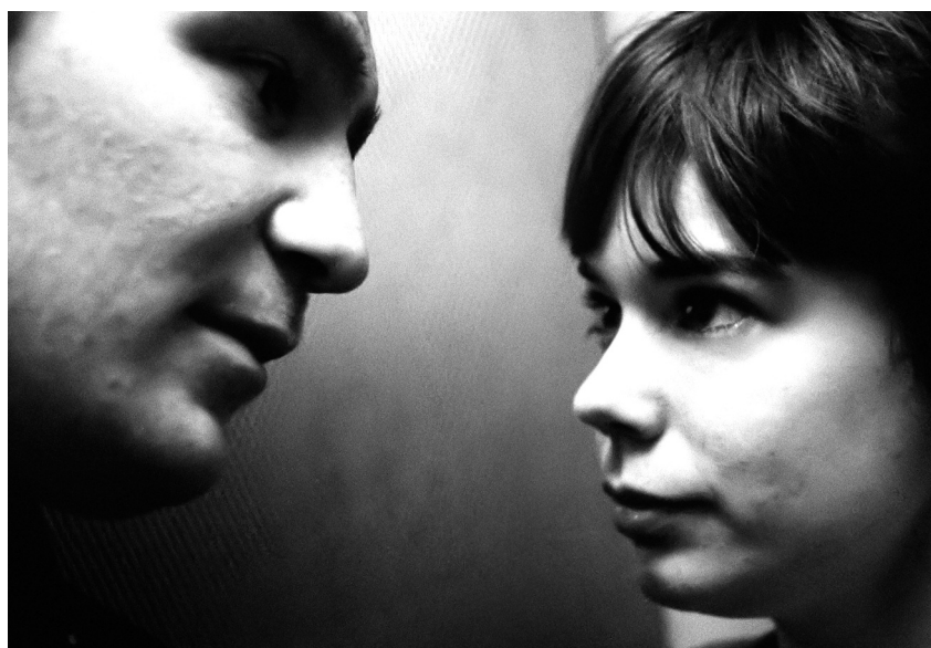
Victoria (Sebastian Schipper, 2015)

Siguiendo el descenso, 13 minutos para matar a Hitler (Elser: Er hätte die