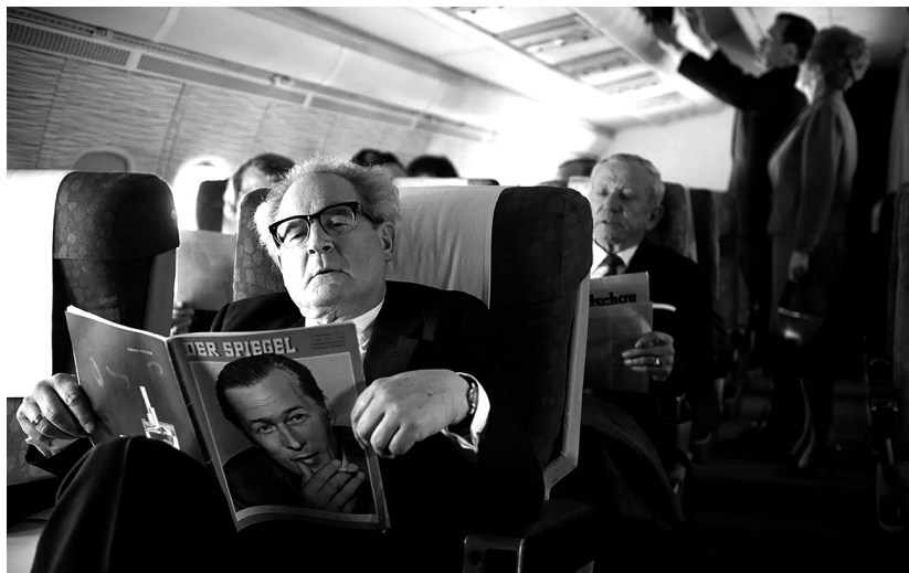
El caso Fritz Bauer (Der Staat gegen Fritz Bauer, Lars Kraume, 2015)

Podemos puede dar un vuelco importante a la representatividad de la izquierda si sobrepasa al PSOE y, en última instancia, lo arrastra a plantearse un pacto en inferioridad que hace nada, cuando habría llevado la voz cantante, rechazó. Incluso en número de diputados las cosas se les pueden complicar a los socialistas, porque la ley D'Hondt ya no perjudicaría tanto a Izquierda Unida, cuyo millón de votos en diciembre solamente les permiti-