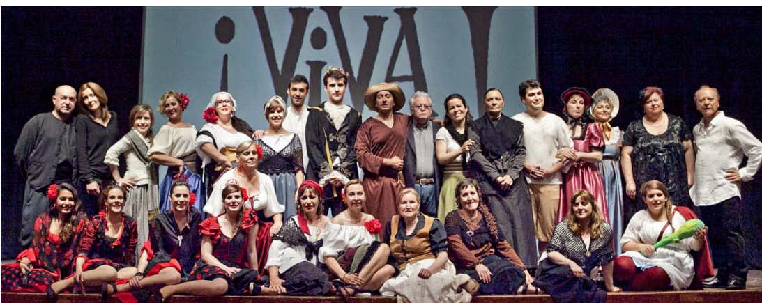
Els figurants han volgut presentar aquesta obra al seu públic fidel que cada any acudim a l'auditori