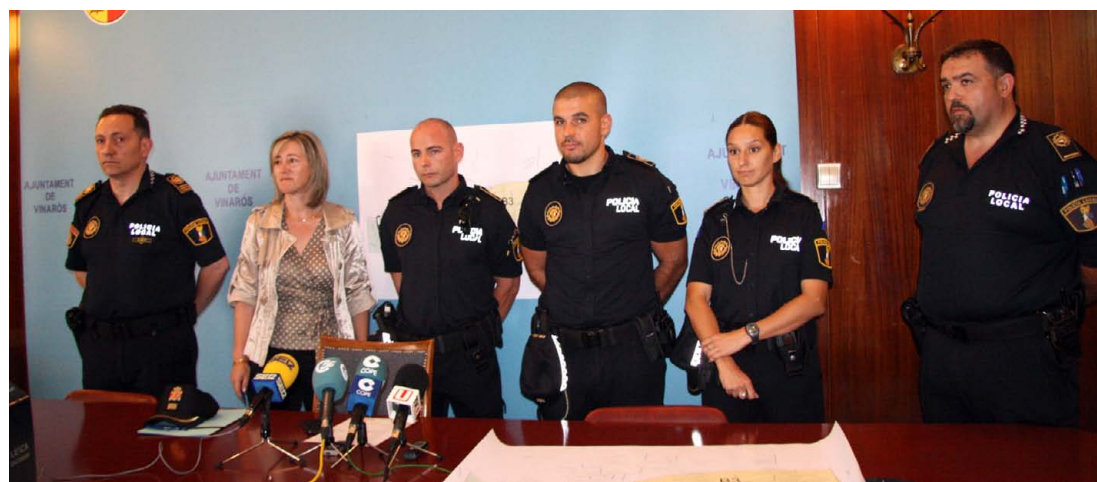
La policía de proximidad ya está presente en las calles de Vinaròs

El intendente también aclaró que en otras zonas del municipio, como las costas norte y sur, Vistabella y la ermita la vigilancia será realizada por la policía de tráfico y rural, al tratarse de zonas que requieren