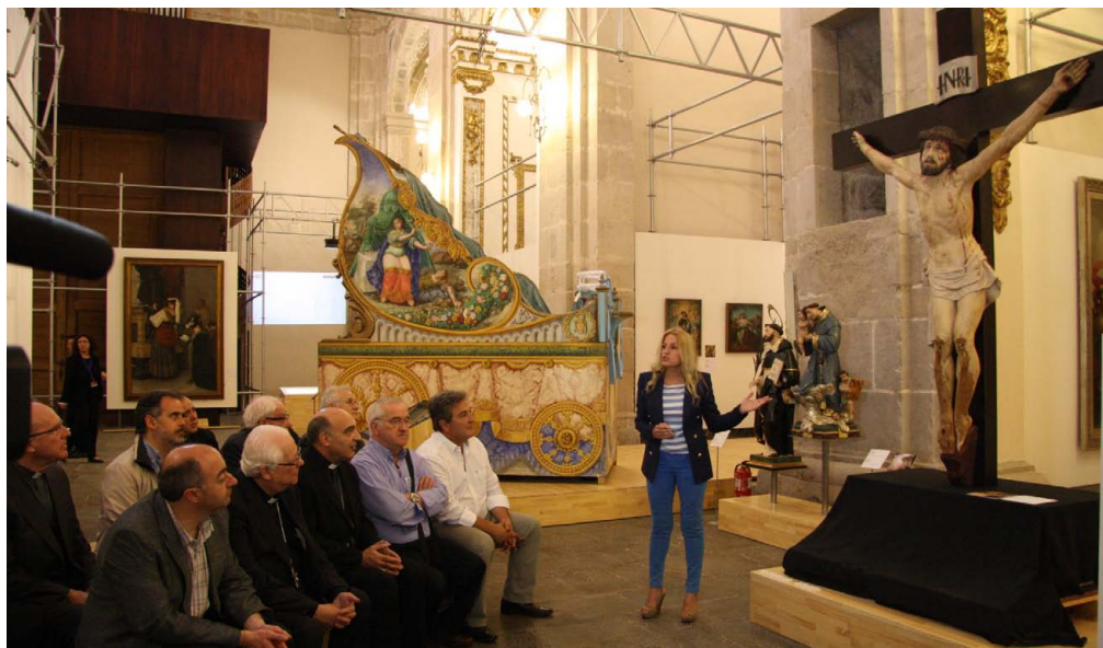
En la presentación se explicó el proceso de restauración al que fue sometido el Cristo de la Paz

Esta imagen, que representa a un Jesús crucificado aún vivo, responde al movimiento artístico del Academicismo, datado en el siglo XX, y que recupera para la imaginaria religiosa los modelos del siglo XVIII. Según consta en la iglesia de la Asunción, esta imagen fue un regalo del Papa Pío XI, que recibe Vinaròs cuando se encontraba en esta parroquia el Cardenal Tarancón, en plena Guerra Civil.