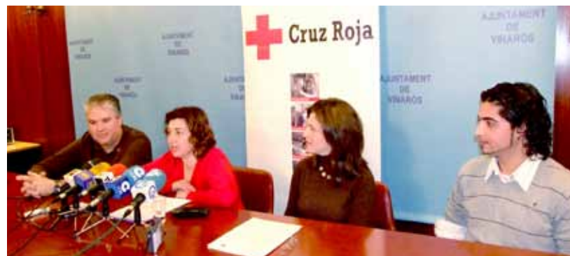
Presentació. El taller durarà quatre mesos

els serveis socials municipals han estat atenent el col·lectiu immigrant des de l'inici de la seua posada en marxa l'any 1986 amb recursos propis i la col·laboració de diferents institucions. Des de setembre de 2005, l'Ajuntament s'ha fet càrrec del finançament d'un servei especialitzat que culmina amb la creació de l'agència AMICS. Entre les seues línies de treball hi ha la cooperació entre administracions i institucions i el foment de la immigració i convivència intercultural, "per això mantenim contactes amb la Creu Roja provincial durant el 2008, per poder tindre un servei de mediació intercultural que s'ha concretat amb