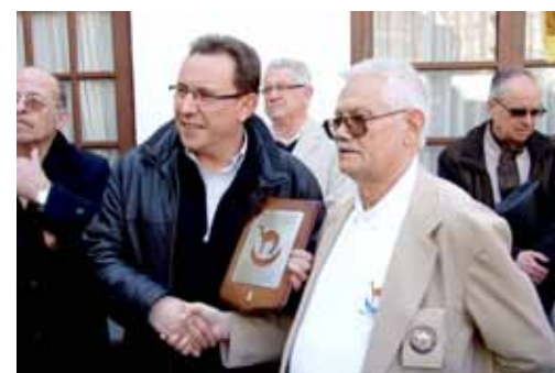
L'alcalde, com a representant del consistori, va rebre una placa del president de l'associació