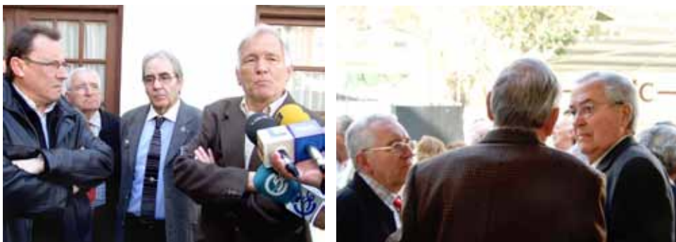
Dos vinarossencs que van lluitar en aquesta guerra, van intercanviar les seues impressions tant entre ells com als mitjans de comunicació