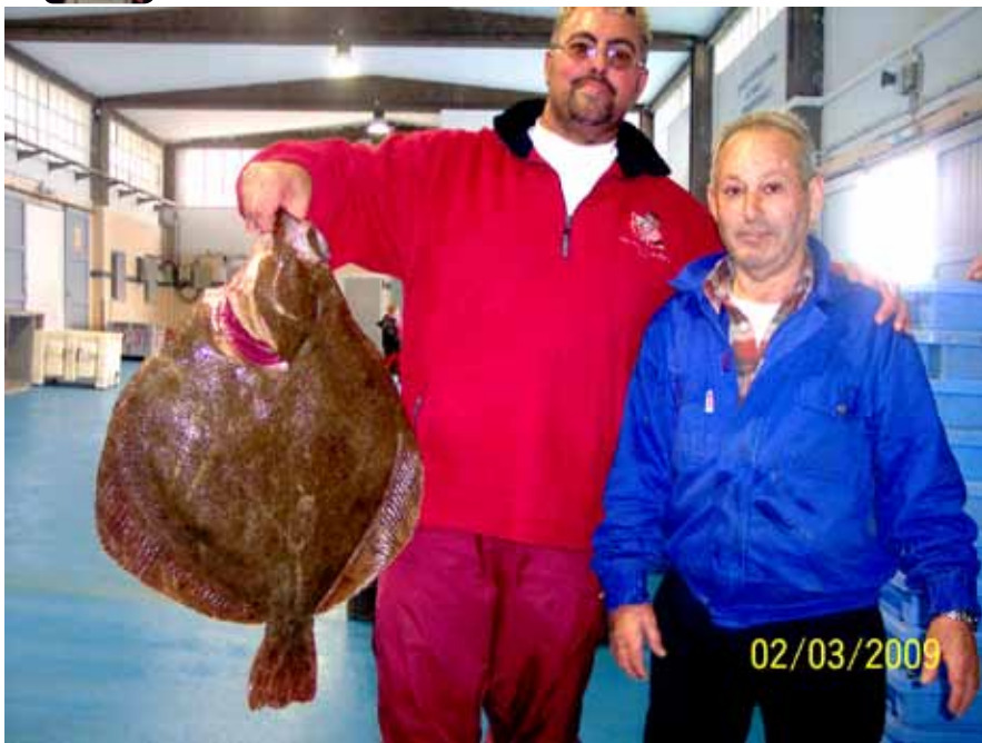
Bones captures de rom empexinat