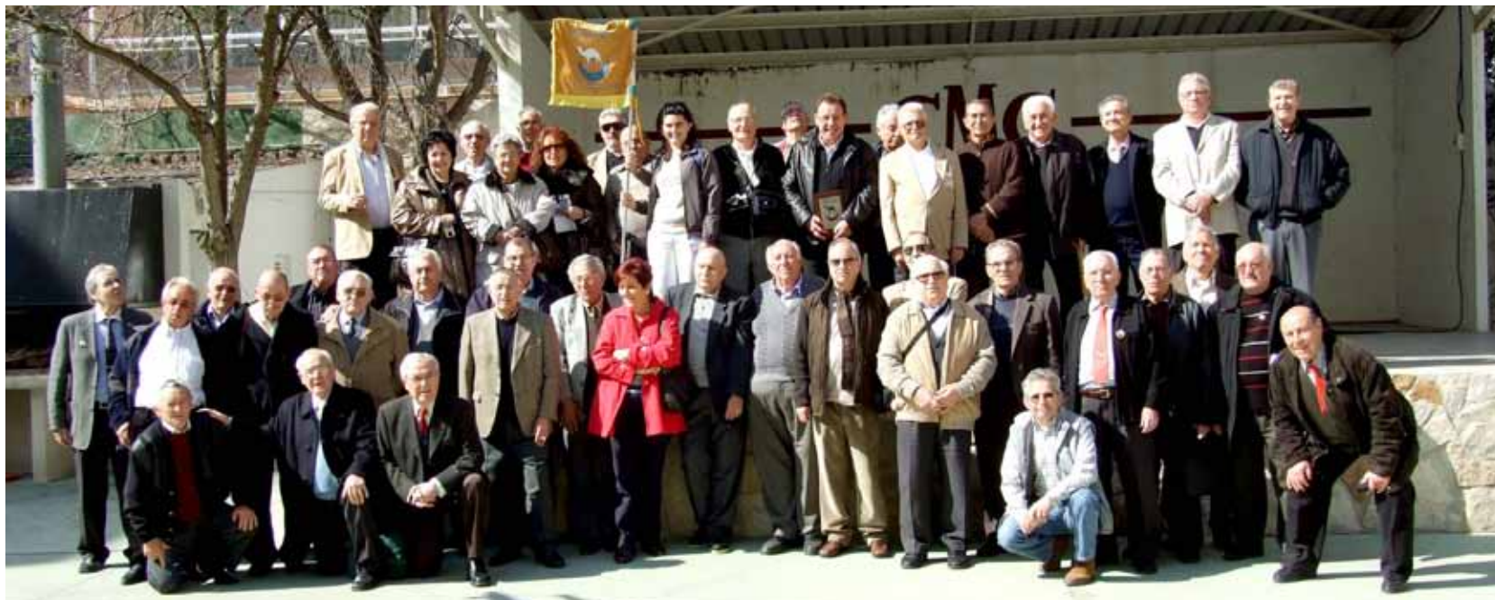
A la foto, amb l'alcalde, tots els membres desplaçats a Vinaròs des de diferents punts de l'estat que van participar en el conflicte