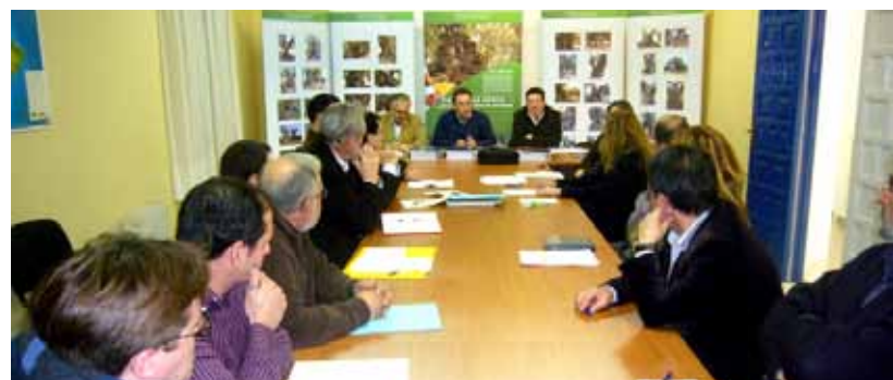
Reunió de la Mancomunitat a la seu de Vinaròs