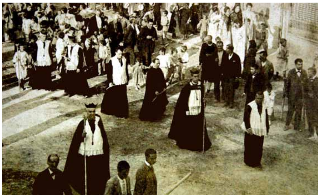
"Plaça de Jovellar, processó del Corpus a principis del segle xx"