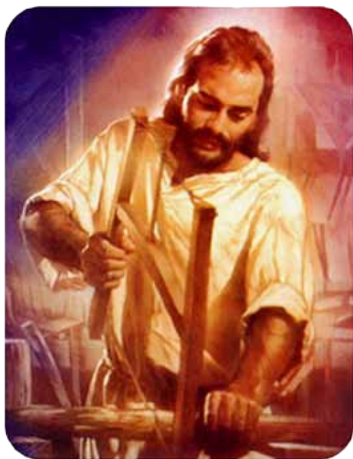
"Imatge emprada en la propaganda dels Círculos"