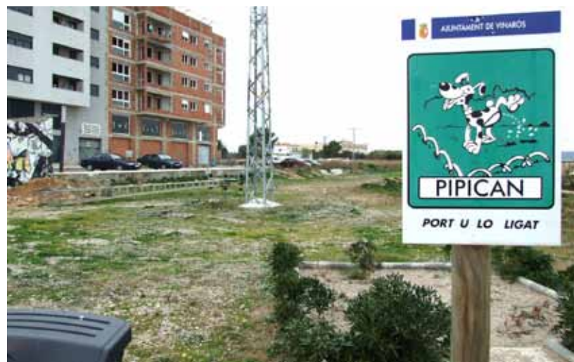
La zona del Parc de Les Catalinetes ha estat l'escollida per a la seua ubicació

Aquest tipus d'espais ja són habituals en països europeus on hi ha una presència important de gossos a les llars. Els propietaris de gossos de Vinaròs gaudiran així d'un lloc específic per passejar-lo i evitar problemes sanitaris i de convivència. El lloc escollit, vora el Cervol i darrere del parc de les Catalinetes, ha estat escollit per no minvar en cap cas l'espai reservat a jocs o a passeig dels usuaris d'aquesta zona, ja que per les dimensions del parc, hi ha possibilitat de fer compatibles tots els usos d'aquesta zona verda.