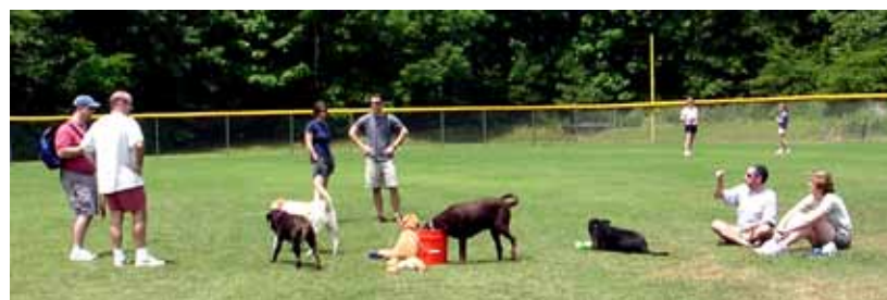
El gosparc és un projecte pioner a la província, però habitual en diferents ciutats europees, que permet al gos socialitzar-se i desenvolupar activitat física