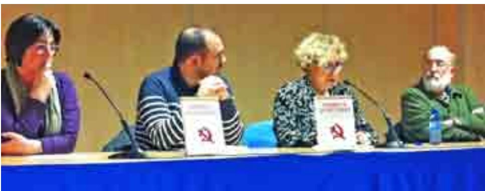
Moment de la presentació. El llibre és un homenatge a les dones lluitadores dels primers anys del segle XX

Amics de Vinaròs organista la presentació de l'obra, basada en la vida de Luis López-Dóriga