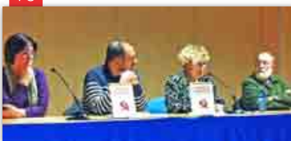
Retrat d'una història d'amor amb rerefons històric