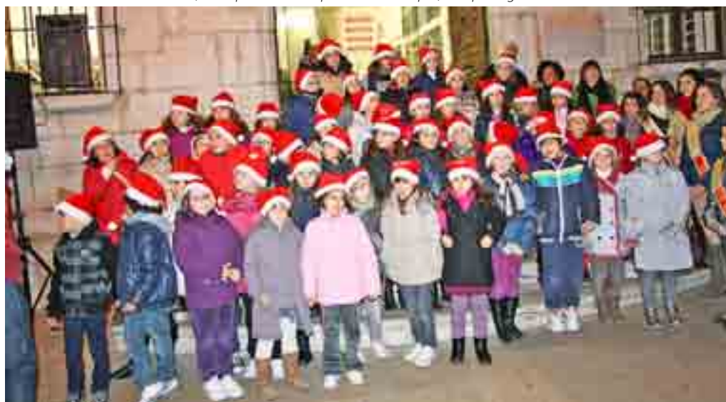
Les corals dels col·legis de la localitat van cantar nades a les portes del consistori