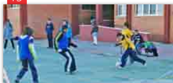
Dia internacional de les persones amb discapacitat