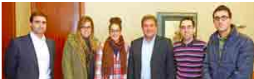
Los becarios que han comenzado hoy sus prácticas se han distribuido en 4 departamentos del Ayuntamiento

Amat: "Estas 11 becas tienen como objetivo poner en valor la formación y otorgar nuevas oportunidades de empleo a jóvenes de la ciudad"