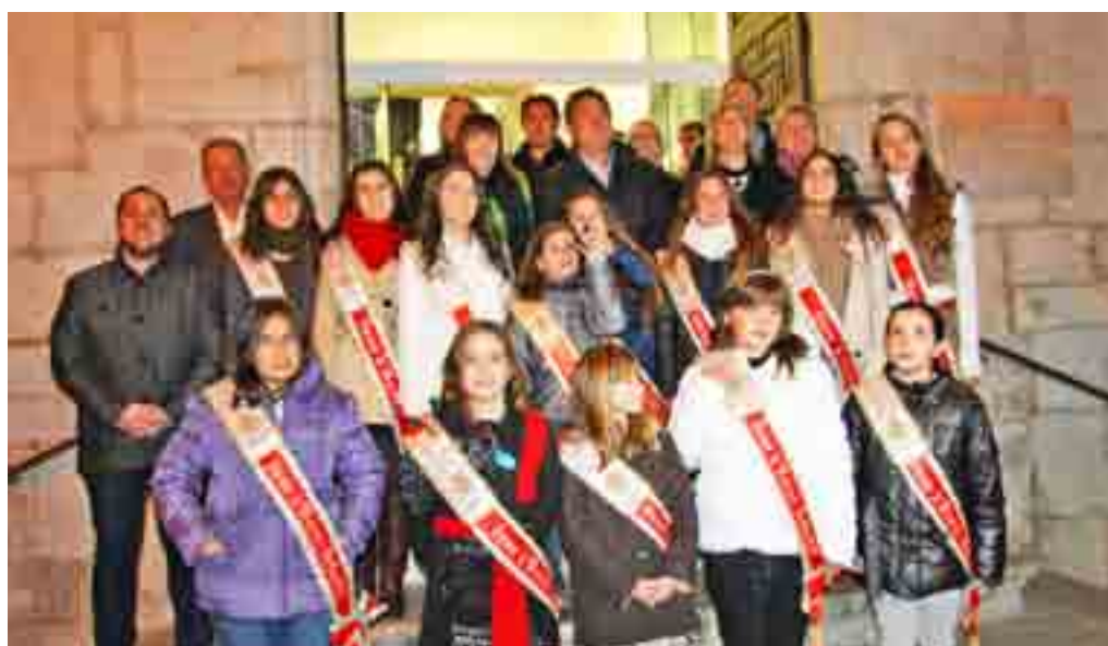
Les dames i reines de les festes, amb part de la corporació municipal, van protagonitzar l'encesa de les llums