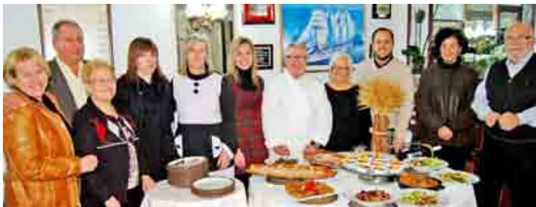
En la presentación de las jornadas, estuvieron presentes diversos concejales de la corporación municipal