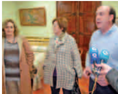
Entre altres peces, destaquen dos vestits de casament, molt diferents al que s'estila avui en dia

El president de Caixa Vinaròs Manuel Molinos destacava que són una manera de reflectir la societat vinarossenca de finals del segle XIX. Entre altres peces, destaquen dos vestits de casament, molt diferents al que s'estila avui en dia. També hi ha un llit cedit per un comerç del moble, sobre el qual hi ha una bànuca que va ser pintada per Hilarió Claramunt, rellevant pintor vinarossenc. L'exposició porta per nom "Vestits i