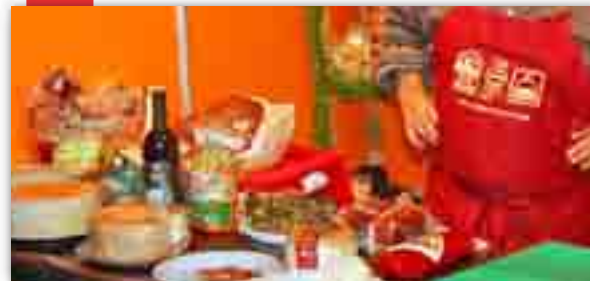
El primer mercat nadalenc anima el centre de Vinaròs