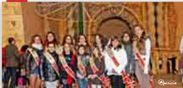
L'encesa de les llums