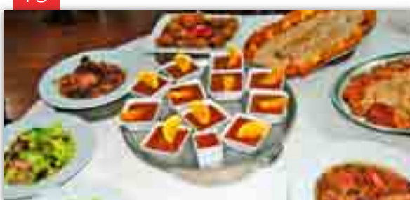
La cocina de caza vuelve por Navidad