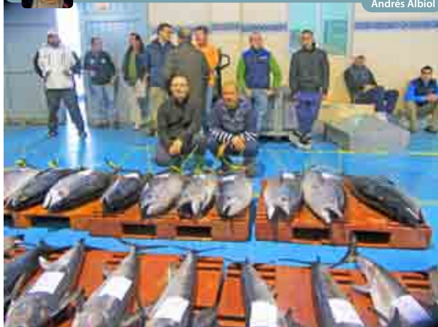
Pescadores del marrajero 'Port de Vilanova' desembarcaron en nuestra lonja atún rojo y emperadores