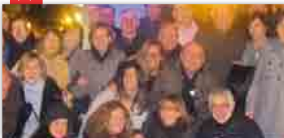
32 anys després...