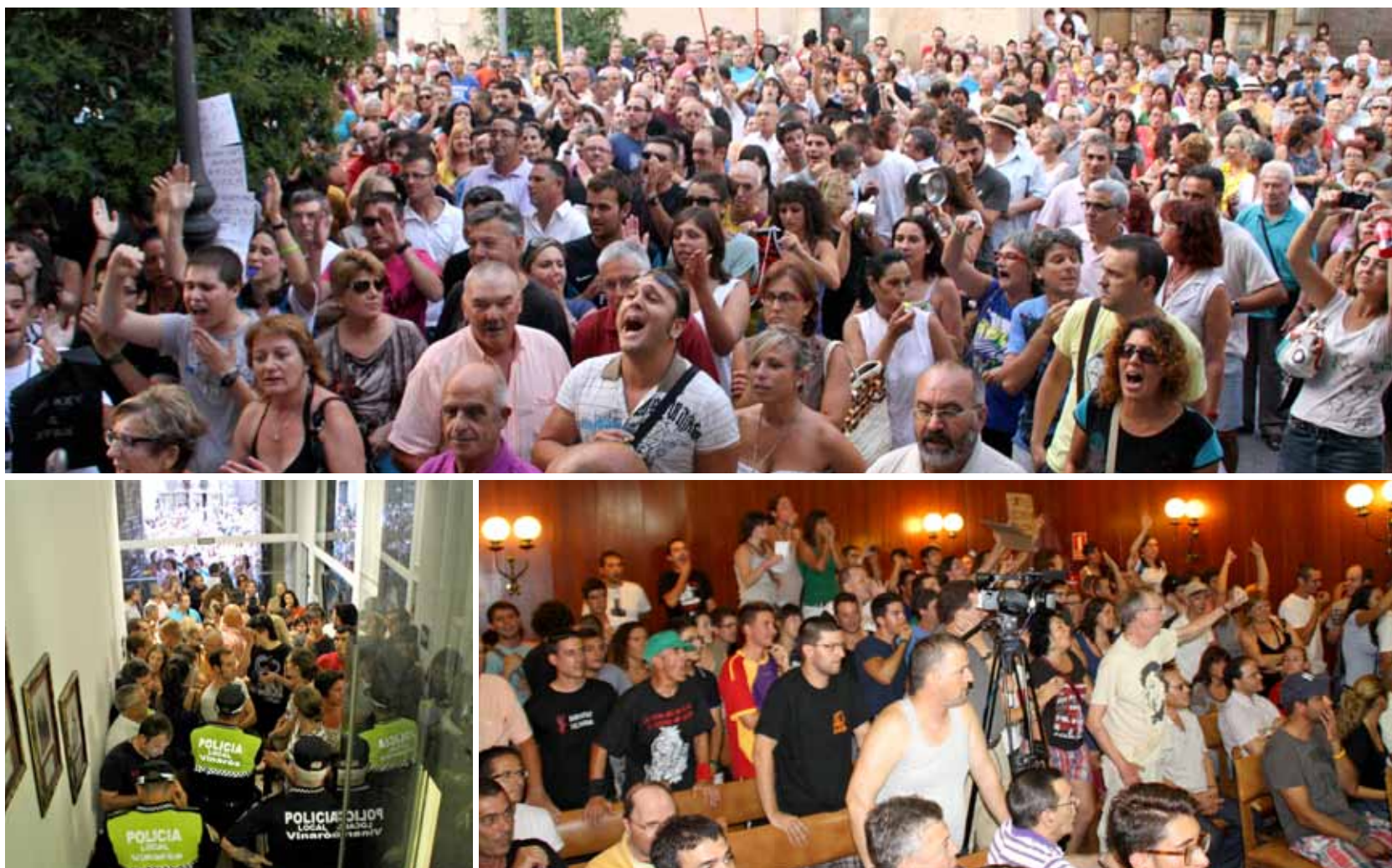
Moments de la concentració, l'accés al consistori i el saló de plens del dia 26 de juliol a la tarde