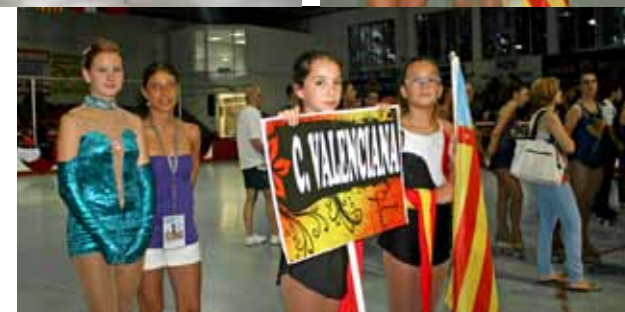
Club Patinatge Artístic Vinaròs.

El pasado 13 y 14 de Julio, tuvo lugar la celebración del XX Campeonato de España Junior 2012, en la ciudad Catalana de Mollet Vallés, concretamente en el Pabellon Municipal Riera Seca.