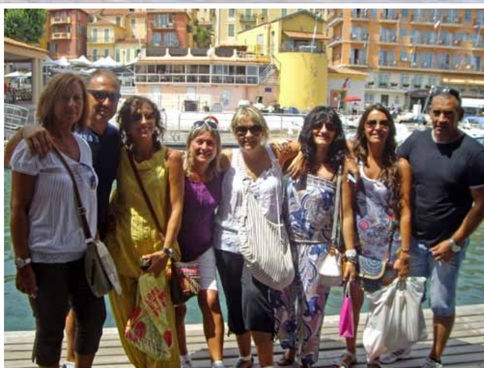
Vinarocenses de Crucero por el Mediterráneo, haciendo escala en el Principado de Mónaco y la Costa Azul