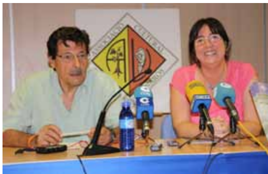
Associació cultural amics de Vinaròs

Amics de Vinaròs publica un nou número de la Revista Fonoll