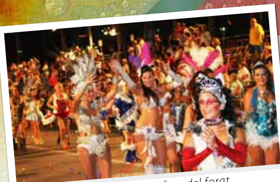
torna el carnaval d'estiu a fora del forat