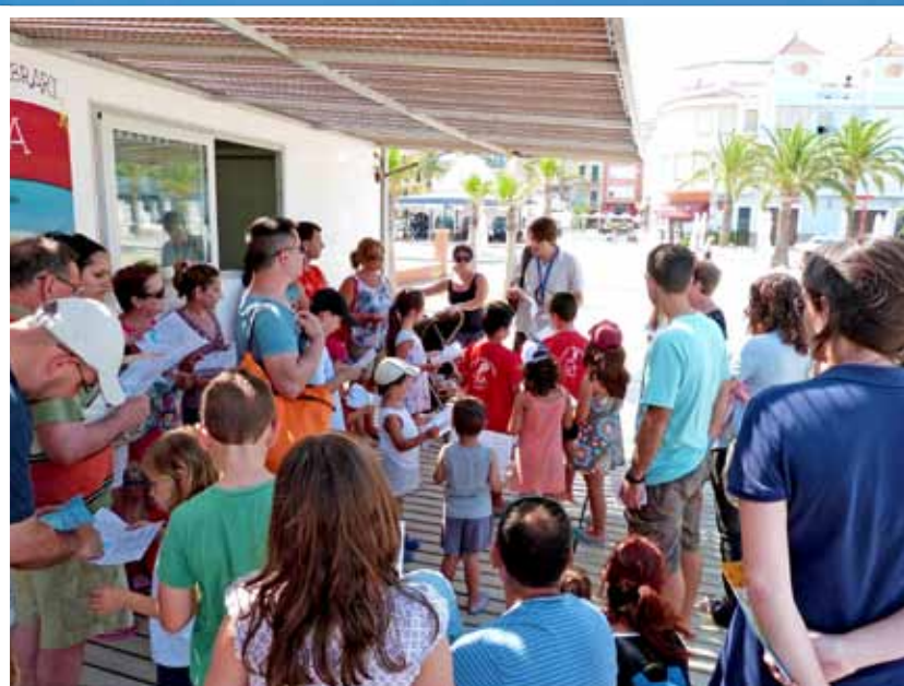
Visita guiada al puerto pesquero y lonja de pescado dirigida al público infantil. Una de las actividades que pueden realizarse dentro de las actividades turísticas.