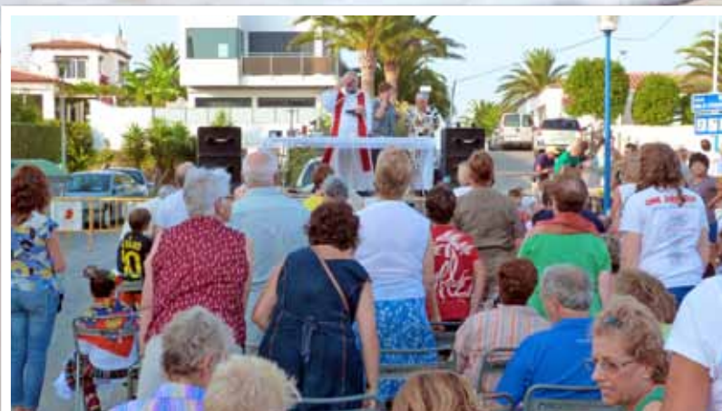
Vinaròs va celebrar la festivitats de Sant Jaume