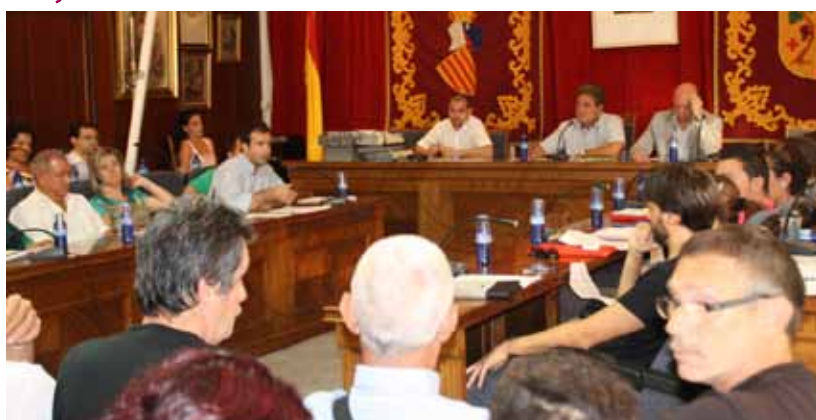
El ple es va poder desenvolupar dimarts al matí