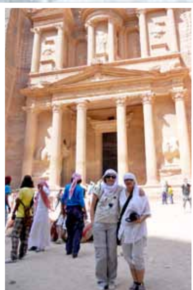
Vinarocenses en Petra