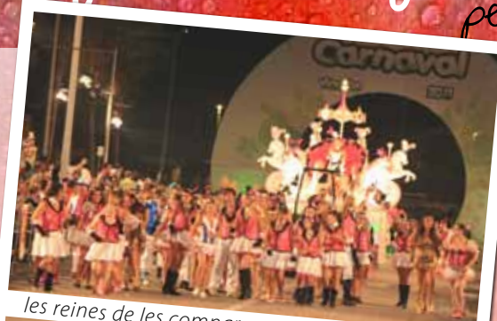
les reines de les comparses, protagonistes

Vinet, qui et va batejar? L'agost, que em va remullar