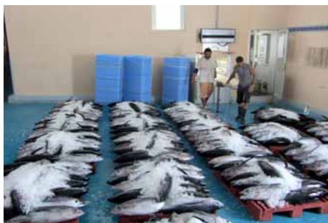
Subastas de atún blanco

Semana también con unas aguas calmadas que no dieron buena productividad en general. En algunas pesqueras como la del peix blau apenas hubieron subastas, ya que esta fase Lunar no les es propicia, pero en cambio en otras mas artesanales de la xarxa , se capturaron bastantes mariscos, pues la luz nocturna les hace salir de sus escondrijos.