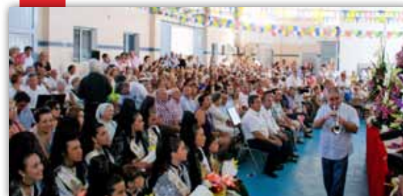
Festes del Carne