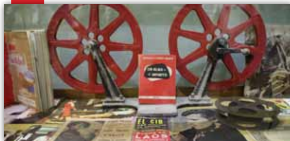
A la llum de la Lluna