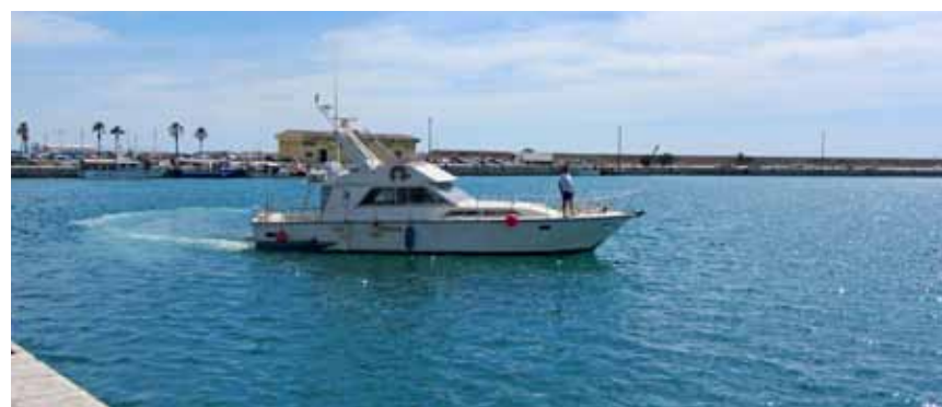
lancha patrullera de la Generalitat Valenciana en misiones de inspección

Otro marrajero llevó 2.000 Kg., de albacora a 4 €/Kg., y 200 Kg. de pez espada a 10.