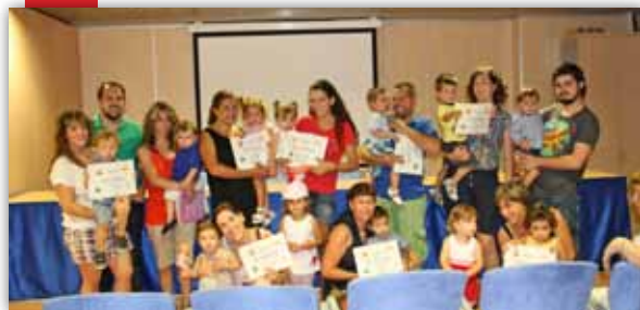
Taller de bebeteca