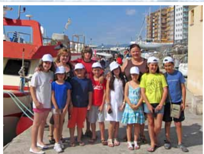
Un grup d'alumnes de l'associació Cultural Arc Iris, acompanyats dels seus professors, van realitzar una visita al port per realitzar una sessió emmarcada dins el taller de fotografia.