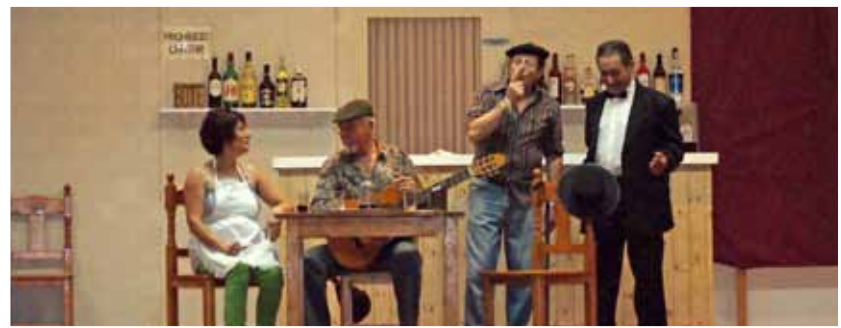
El sábado 14 de julio el grupo de teatro candilejas actuó con gran éxito en la población de sot de Ferrer (Castellón) con la obra que siempre gusta a todos los públicos. Pepe siempre sera pepe.