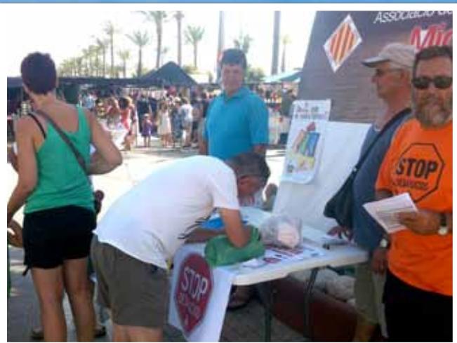
L'associació de veïns Migjorn continua la recollida de signatures per la I.L.P. afectats per la hipoteca cada dijous o dilluns a les 9 de la nit al local del carrer Sant Nicolau, dalt de Les Camaraes.