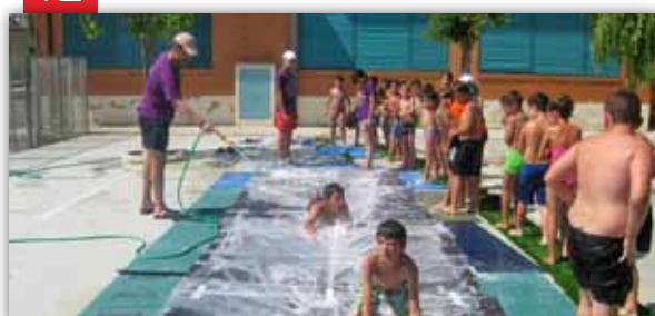
L'illa: primera quinzena