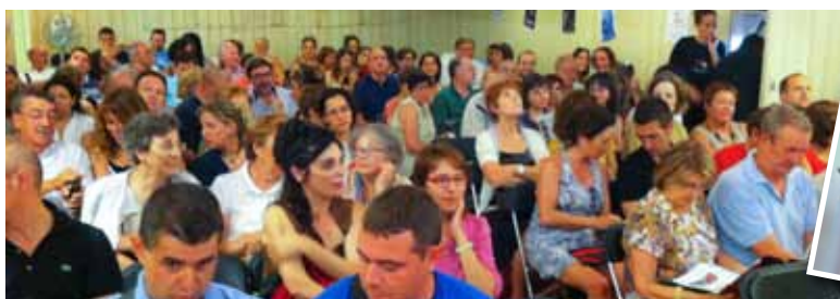
El públic ha tornat a omplir les sessions en aquesta onzena edició del cicle