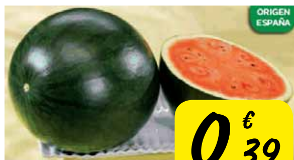
Sandía Negra Var.: Sugar Baby, Cal. 4/7, Cat. 1ª El Kg.