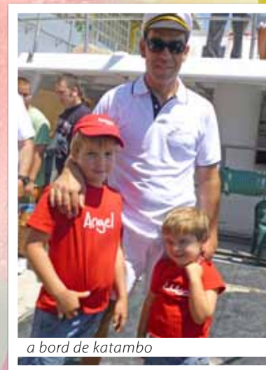
a bord de katambo

La puça que neix per Sant Jaume, per santa Anna és rebesàvia