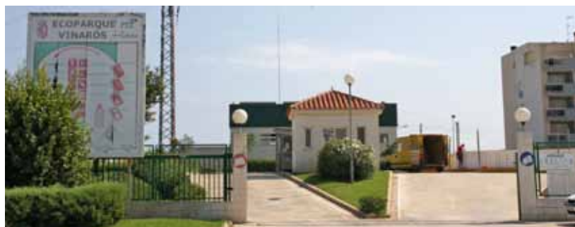
Vista del ecoparque fijo actual

Los terrenos del actual revertirán en el Ayuntamiento cuando finalice el contrato con la UTE, en enero