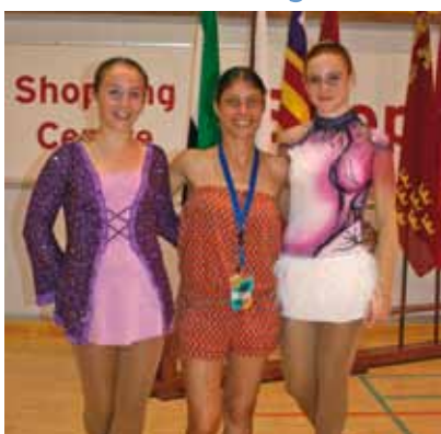
Club Patinatge Artístico Vinaròs

Cinco representantes de la Federación de Patinaje de la Comunitat Valenciana participaron el pasado 22 y 23 de Junio en el Campeonato de España Cadete de Patinaje Artístico, celebrado en Fuengirola (Málaga). Allí se dieron cita un total de 89 participantes pertenecientes a los clubes que representan a las 17 Comunidades Españolas. La competición en Fuengirola, estuvo marcada por el alto nivel de todas las