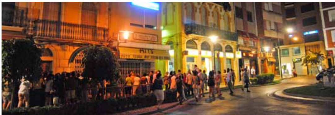
El recorregut va incloure la visita a cases que són el màxim exponent de l'estil modernista a la localitat