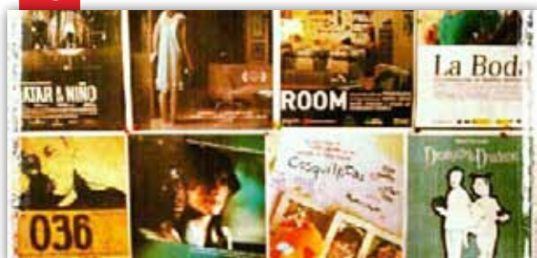
Cicle de Curtmetratges