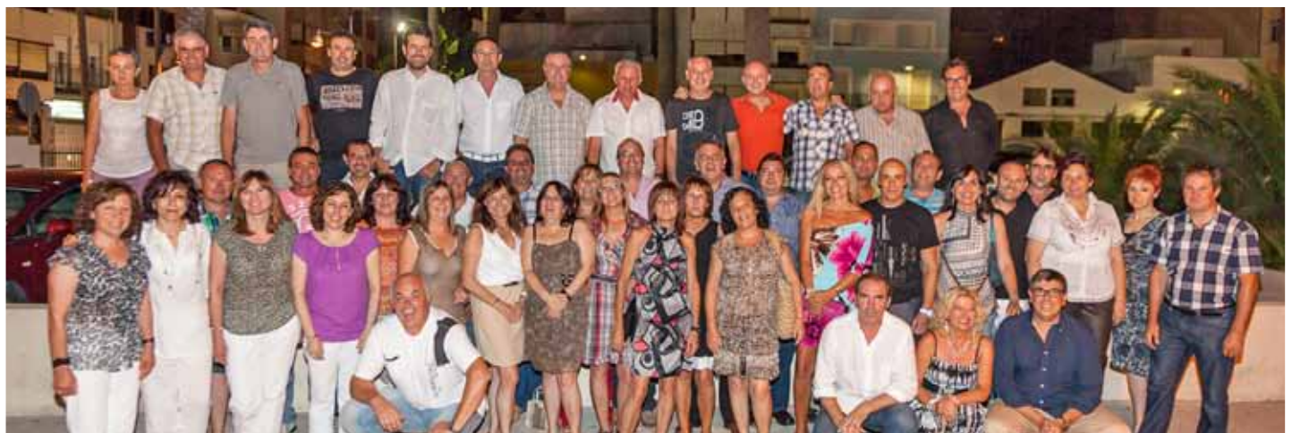
Trobada d'ex-alumnes del col.legi Misericordia de la promoció 1977