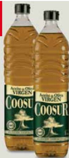
Aceite de oliva virgen COOSUR