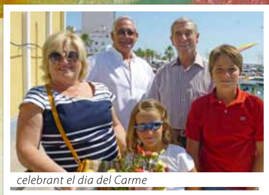
celebrant el dia del Carme