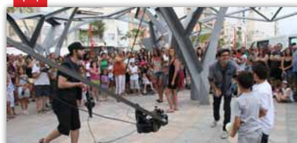
Festival Internacional de Circ