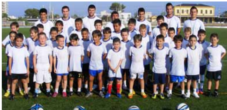
Escola Futbol Base Vinaròs C.F.

El Fútbol Base Vinaròs cf. ha finalizado la primera semana del III campus Jordi Pablo , han participado 30 Alumnos que se lo han pasado en grande, las jornadas han transcurrido de la siguiente forma, de las 17 horas a las 18:30 horas, técnica individual, posesión del balón, etc.. a las 18:15 piscina para los mayores, a las 18:30 se ha repartido fruta para todos los alumnos, de las 19:00 horas a las 20:horas, técnica colectiva, y a las 19:45 piscina para los más pequeños, al finalizar la jornada se les ha entregado un tortazo de la marca (Bimbo) a cada alumno, quedan 2 semanas de campus, para la segunda semana hay 33 alumnos y para la tercera semana 32 alumnos, comentarles