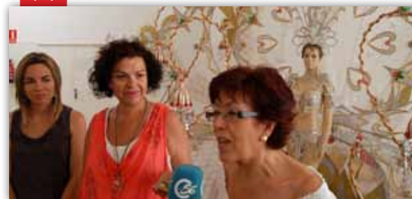
Exposició al mercat