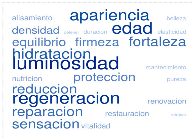
Ilustración 6 Beneficios

dirigidos retornar a la esencia natural (regeneración, reducción, reparación, restauración, equilibrio, vitalidad), enmascarando los efectos realmente probados de este tipo de productos (hidratación, sensación).