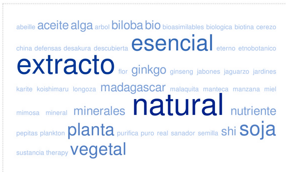
Ilustración 3 Naturaleza

La utilización de valores asociados a la Naturaleza se muestra con claridad con la utilización multitud de términos que envuelven los productos en discursos de autenticidad validados por una supuesta pureza primigenia natural (esencial, extracto), combinando ingredientes naturales con algunas dosis de exotismo (soja, aceite, alga, ginkgo, shi)