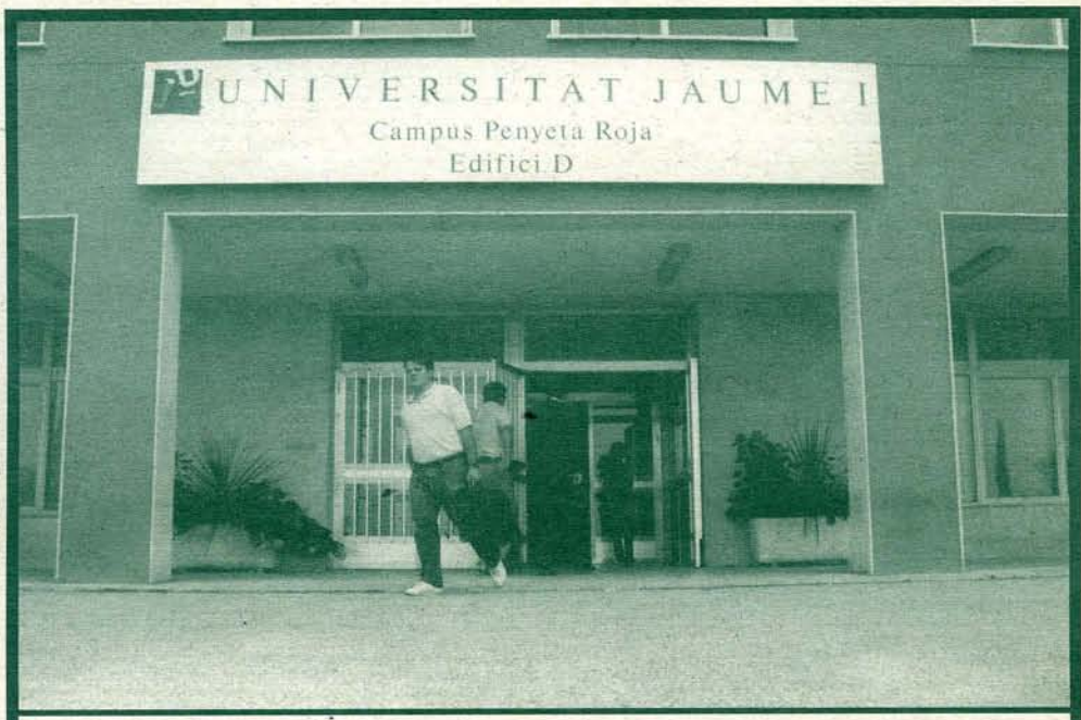
El Campus de la Penyeta Roja comença a ser història. Quan deixarà d'existir, els problemes que comporta, el després, i tot allò que t'interessa saber. (Passa a la pàgina 2)