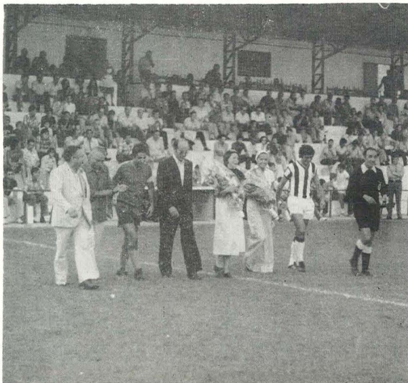
Momento de la salida al terreno de juego de los capitanes del Benicarló y del Castellón, acompañados por el Alcalde de la ciudad, la Reina de las Fiestas, Miss Dulcinea, los Presidentes de ambos equipos, así como el árbitro del encuentro celebrado en las pasadas Fiestas Patronales.

... Que los niños del colegio de «San Ildefonso», que cantaron el Gordo del Día del Turista, en Benicasim (por cierto, sin dejar una perra por estos lares),