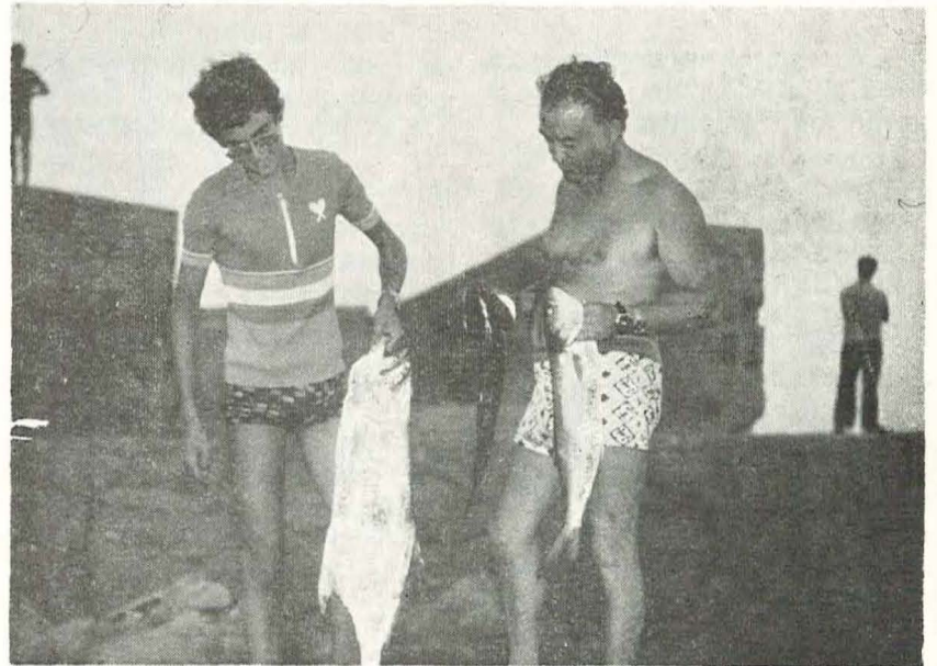
SOCIEDAD DEPORTIVA «EL MERO»

Participaron 9 equipos compuestos de cuatro personas cada uno de ellos. Constante actividad de la Sociedad de Pesca Deportiva «El Mero», que cada día tiene más adeptos y más asociados. Deporte sano, al aire libre, que va adquiriendo pujanza y fuerza entre la juventud.