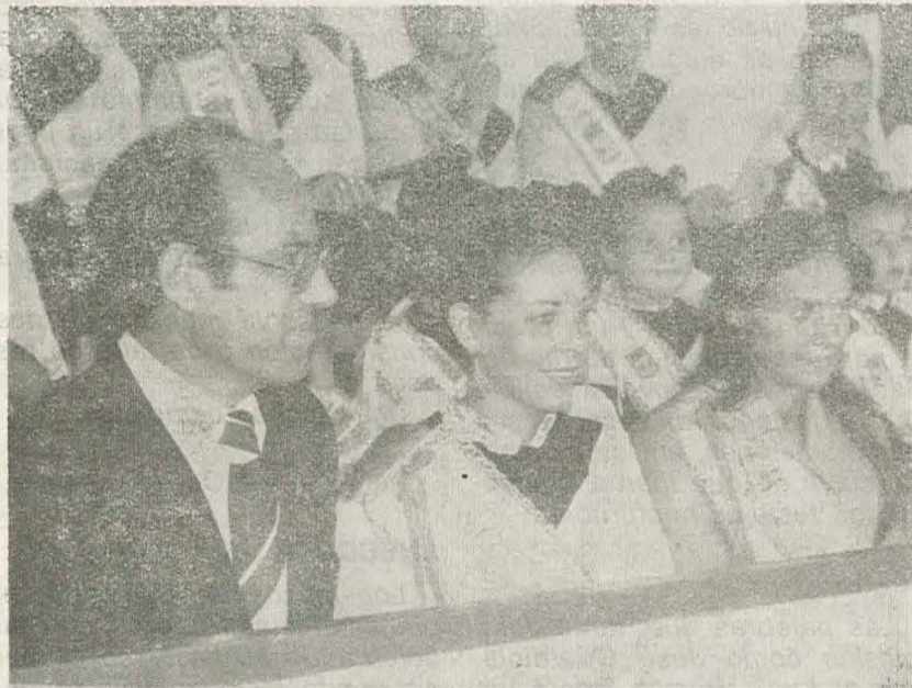
El Alcalde de la ciudad, acompañado por la Reina de las Fiestas y Miss Dulcinea, en un palco del Campo de Deportes Municipal.

A la que acudió la Reina y Corte, y en la que el ermitorio de