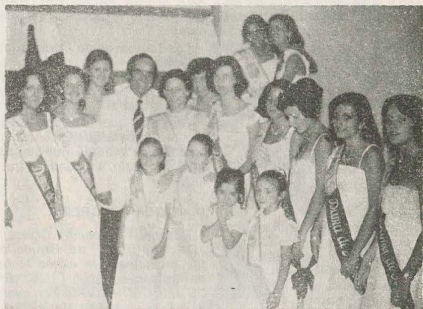
El no menos famoso José Guardiola, también rodeado de nuestras bellas representantes.

Los mozos, viendo que las fiestas andaban ya por su final, se dirigieron a la presidencia, donde estaba el señor Alcalde y la Reina de las Fiestas con su