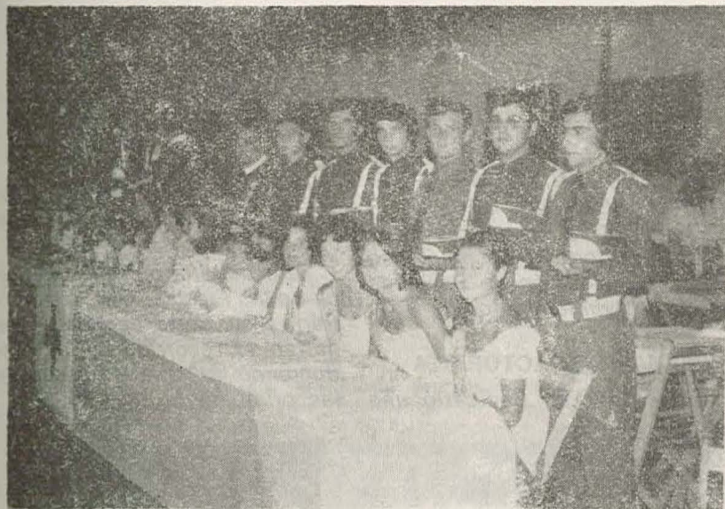
Esta era la mesa donde se situaron la Reina de las Fiestas y sus Damas de Honor, en la Fiesta que se celebró a beneficio de la Cruz Roja.

ellas, hasta los 2.000 Km. en progresivas sueltas.