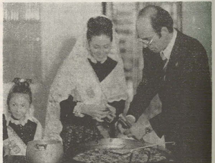
Este fue el momento en que el Alcalde y la Reina de las Fiestas, en la Residencia de Ancianos, se disponían a condimentar la exquisita paella que más tarde sería servida a los residentes.

Concurso nocturno de Pesca, Concierto popular de la Banda de Música «Ciudad de Benicarló» y la puesta en escena, en la Terraza Rex, de la zarzuela «Los Gavilanes», con escasa asistencia por mal tiempo, en el que «Doña Luvia» comienza a ser protagonista principal, aparte que sobre la medianoche acla-