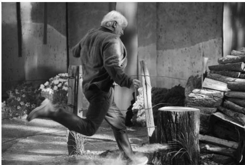
Aimer, boire et chanter

También por doctrinaria nos cargó la última entrega del tándem Ken Loach (director) – Paul Laverty (guionista), Jimmy's Hall (2014), especie de continuación de El viento que agita la cebada ( The Wind that Shakes the Barley , 2006). Como cinta británica, preferimos la intimista Nunca es demasiado tarde ( Still Life , Uberto Pasolini, 2014), sobre las desventuras de un funcionario que se dedica a buscar a los familiares de difuntos cuyos cuerpos (y herencias) na-