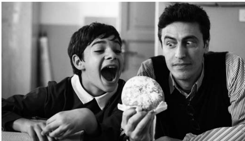
La Mafía uccide solo d'estate

die reclama; con una puesta en escena discreta, pero rigurosa en su estatismo, y una gran composición de Eddie Marsan, solo desentona en ella un horrible por edulcorado plano final.