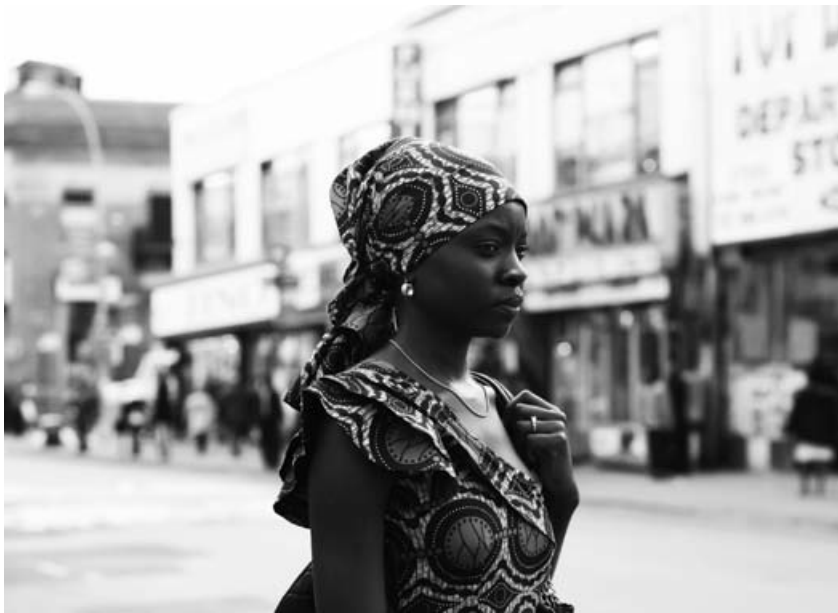
Mother of George

El segundo compartimento está encabezado por la soberbia El amor es extraño ( Love is Strange , Ira Sachs, 2014), sensible crónica del ocaso vital y sentimental de una pareja gay neoyorquina que nos habla del amor con mayúsculas, metafóricamente señalado en las diferentes generaciones, con un tono muy clásico, pero con un par de apuntes discursivos excelentes: el plano retenido de la boca del metro, con lento fundido, y el plano fijo de las escaleras con el adolescente que llora en la intimidad (este concepto, lo íntimo, se cuela por todas las rendijas del film); y por la también recomendable The Skeleton Twins (Craig Johnson, 2014), sobre la compleja relación entre unos hermanos gemelos de tendencias autodestructivas que han permanecido separados durante una década. Norteamericana también es Matar al mensajero ( Kill the Messenger , Michael Cuesta, 2014), pieza de cine-denuncia que trata de remedar al Alan J. Pakula de los años setenta, a través de la reconstrucción de la investigación verídica del periodista que destapó las conexiones entre la CIA, la contra nicaragüense y el tráfico de drogas en los barrios pobres (de población negra) de las grandes urbes estadounidenses; funciona mejor la primera parte (la de la pesquisa) que la