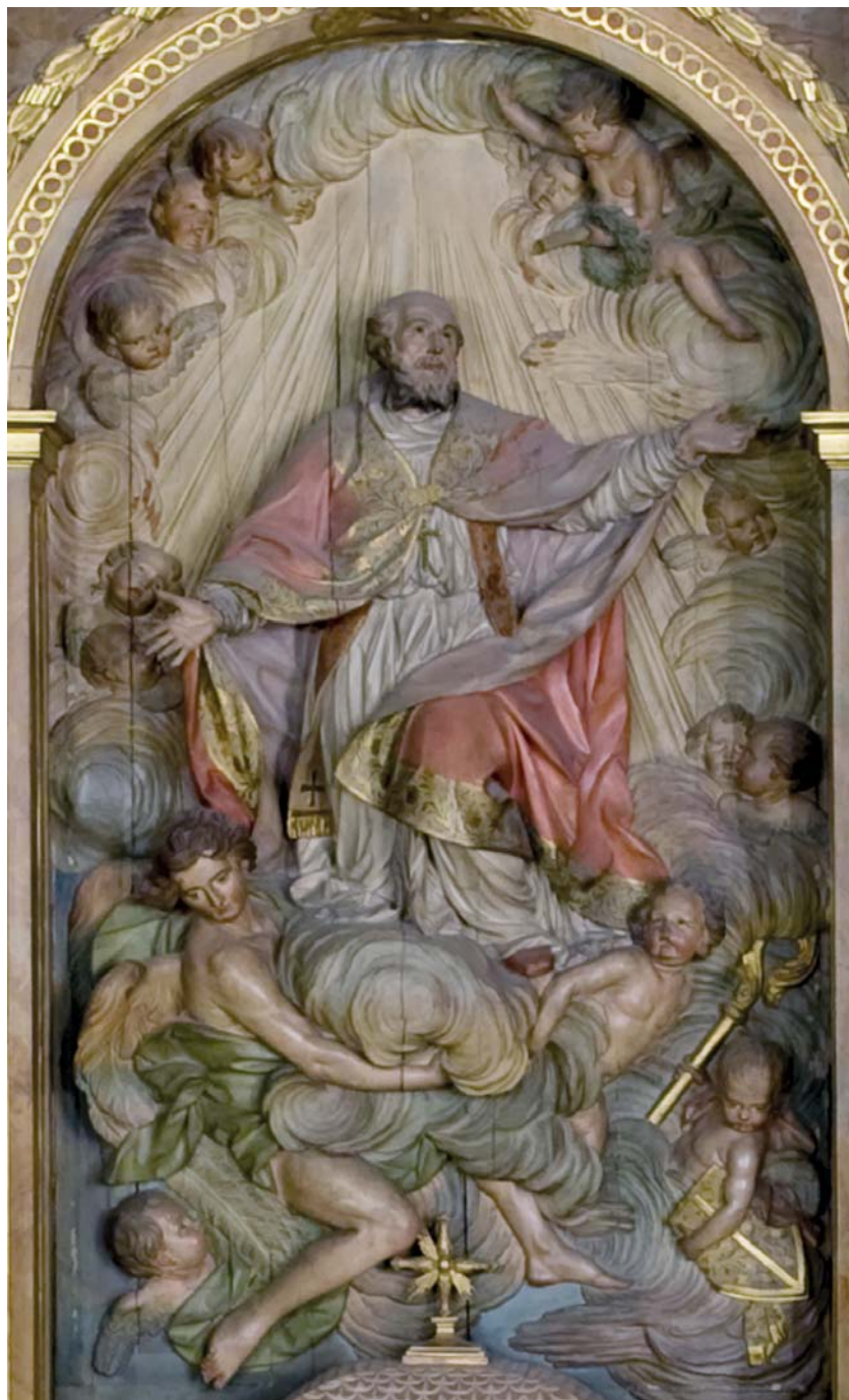
Fig. 5. JUAN ADÁN, Apoteosis de San Eufrasio , 1787, Capilla de san Eufrasio, catedral de Jaén