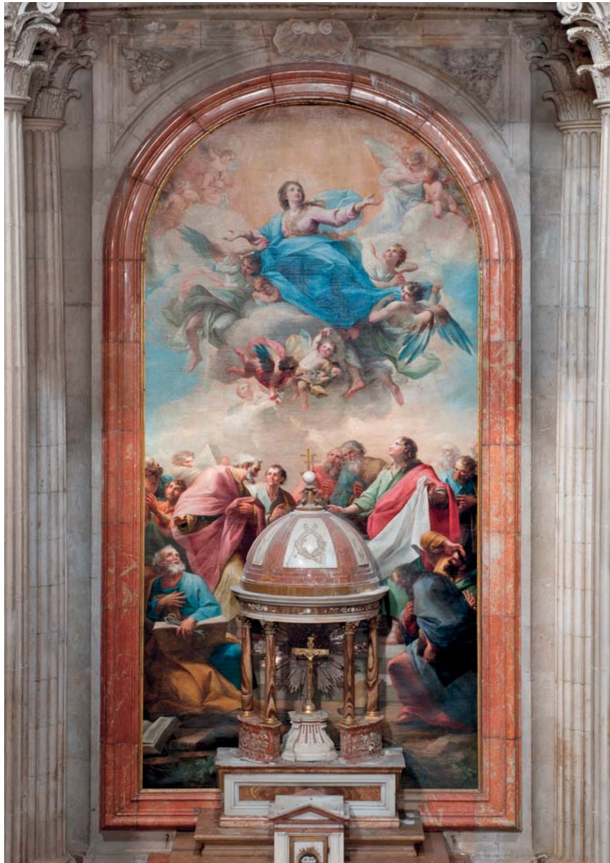
Fig. 7. MARIANO SALVADOR MAELLA, Asunción de la Virgen , 1793-1794, 660 x 305 cm, Sagrario, catedral de Jaén