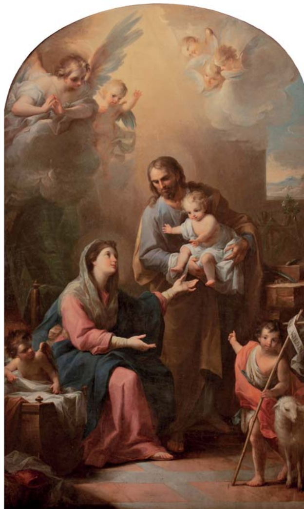
Fig. 6. MARIANO SALVADOR MAELLA, Sagrada Familia , 1792, 286 x 179 cm, trascoro, catedral de Jaén

y como indica la firma del lienzo «Maella facib t año 1792». El pintor del rey la realizó con celeridad, pese a tener que atender un encargo de la reina María Luisa de Parma que quería un San Julián para los premostratenses de Madrid y que corría bastante prisa porque «(...) todo había de estar concluido antes de su feliz parto». 53 El impacto positivo que causó la Sagrada Familia entre los promotores, alentó el segundo encargo que tendría lugar en 1793, la Asunción de la Virgen para el Sagrario.