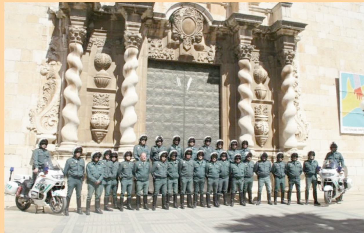
Foto d'arxiu de la façana del temple.

De moment els danys han estat inclosos en un informe tècnic fotogràfic elaborat pels tècnics de la Conselleria de Cultura. La mateixa petició s'ha fet a la Diòcesi de Tortosa.