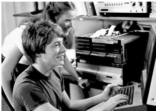
Fotograma de "Wargames": la realitat imita a la ficció

El subjecte tenia un acord amb la companyia de publicitat en línia Simple Internet, d'Holanda, per a la instal·lació del seu programari en computadores d'usuaris, sota la condició que aquests donessin el seu consentiment. Schiefer va usar la