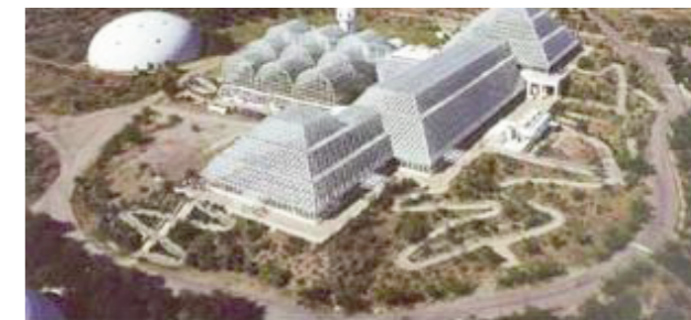
Vista aèria de Biosfera 2

La Biosfera ens proporciona als humans aliments, medicines, materials de construcció i energètics, depura i distribueix l'aigua i l'aire, degrada els residus sòlids i manté la fertilitat del sòl, regula el clima, pol·linitza les flors i dispersa les llavors, controla les plagues dels cultius de forma natural... De tots aquests serveis ens beneficiem quasi gratuïtament. La colonització de l'espai passa per la construcció de bases o nuclis autosuficients que proporcionin als seus habitants tots els serveis que ens dona la Biosfera a baix cost. Als anys seixanta, l'arquitecte nord-americà Ian McHarg dissenyà un mòdul per un astronauta. Consistia en una càpsula amb llum fluorescent i un cultiu d'algues en aigua. Les algues renovaven l'aire i proporcionaven aliment a l'astronauta, els seus excrements i orí les nodrien. Els soviètics van construir mòduls autosuficients, la sèrie Bios. El Bios-3 era un hàbitat de 315 m3 amb cultius d'algues, verdures i cereals. Depenia de l'exterior quant l'energia elèctrica i certs aliments, però reciclava l'aigua i renovava l'aire. Fou ocupat per dos enginyers durant 5 mesos a 1983 i que van entrar amb aliments sols per un mes.