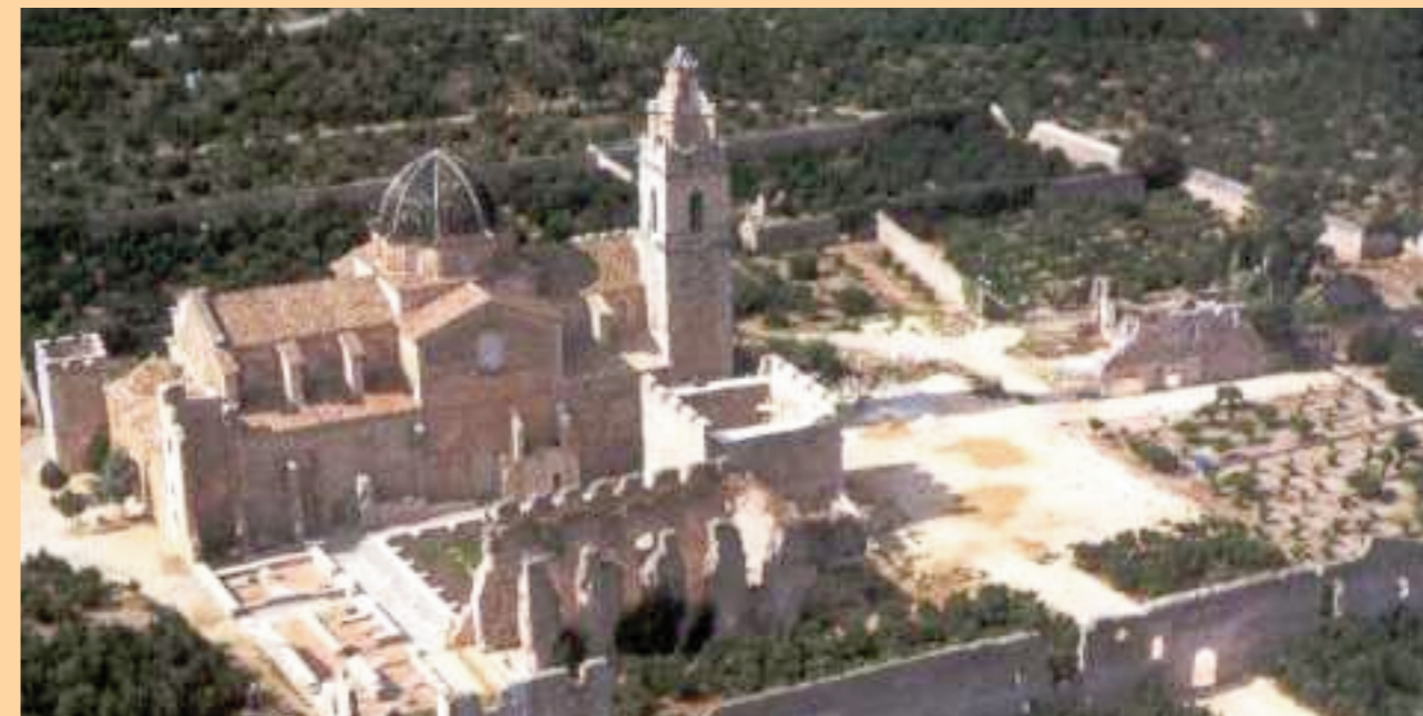
El Monestir de Santa Maria de la Valldigna, marc incomparable de la XVII Escola d'Estiu de l'ACV Tirant lo Blanc.