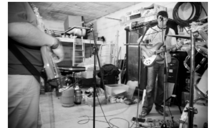
Coco al local

L'espectacle d'entrada lliure disposarà d'una barra els ingressos de la qual s'invertiran en els projectes que "A consciència" ha emprès en el continent africà.