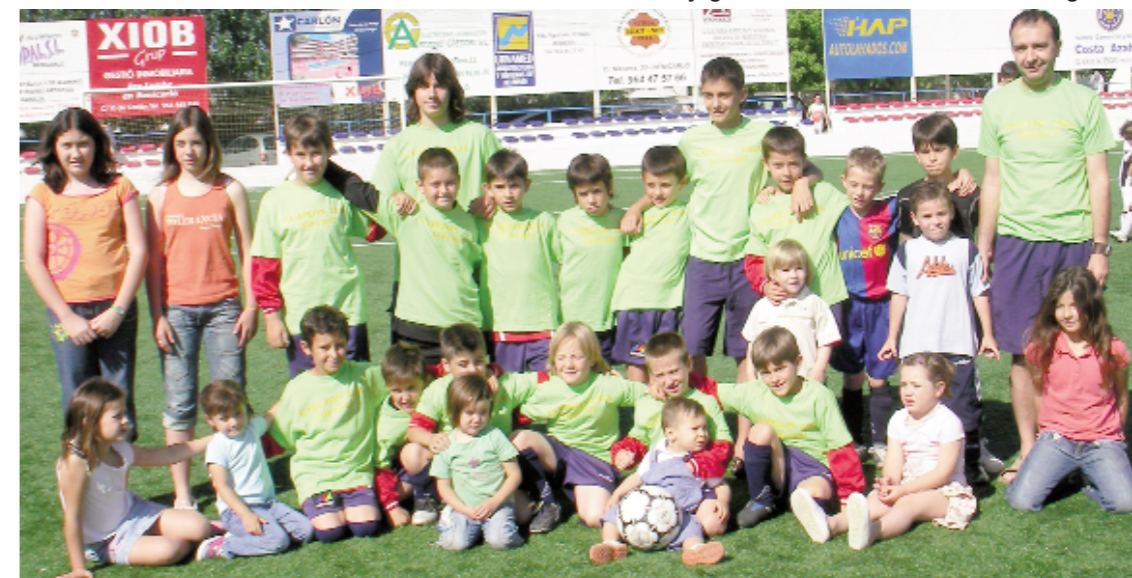
Els jugadors amb els seus entrenadors i germans

L'equip prebenjamí "A" del Benicarló Base Futbol es va proclamar campió del seu grup. Aquest equip, format per xiquets de set i vuit anys, ha guanyat vint-i-cinc partits, n'ha empatat un i no n'ha perdut cap. També cal destacar que ha marcat 219 gols. Enhorabona a tots.