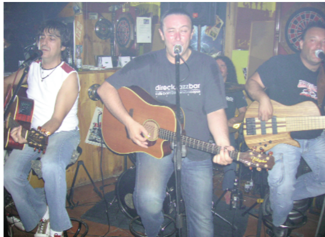
sweet home: hot rod

Com a noticia especial per a este mitjà, el mateix grup va adelantar que formaran part del proxim recopilatori del fanzine benicarlando "la Filoxera", junt a grups com "Relevo de Plata", "Motorzombis", "Four on Six", "Hop Frog" y "MÑM", entre altres.