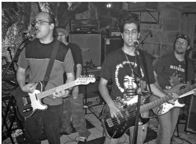
"El sonido más cool"

El grup va tocar un ampli repertori, així com cançons del seu ultim disc "El sonido más cool", que no es varen perdre ni militants d'altres bandes i critics del ram que van estar allí presents per a saborejar desde la primera fins a la ultima nota.