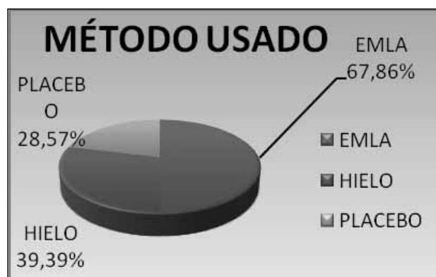
Gráfica I. Método elegido por los pacientes.