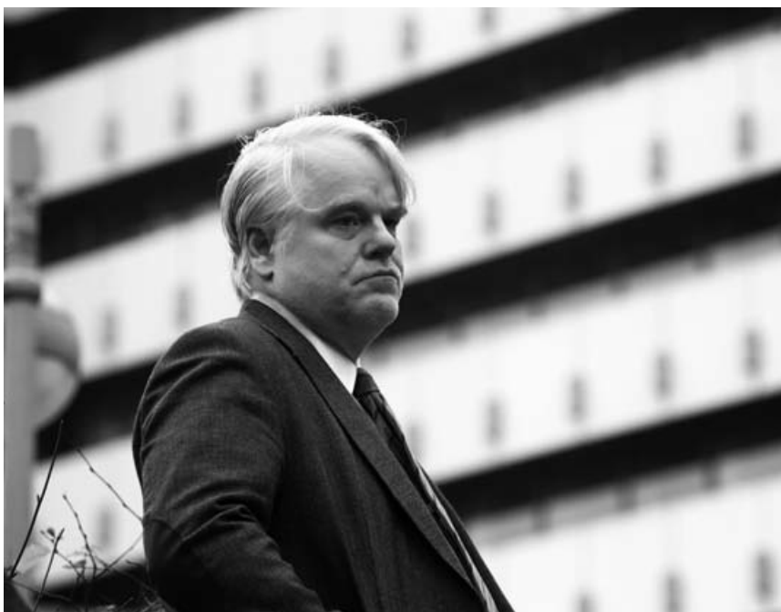
El hombre más buscado

aparte, son tres los aspectos más relevantes que trastoca: uno consiste en postergar la coralidad y concentrar la peripecia en la investigación que capitanea Günther Bachmann (Hoffman); otro, potenciar el personaje de una agente estadounidense, Martha Sullivan (Robin Wright) –paradójicamente, creo que el propósito es el mismo que el de Le Carré: este cifra su antiamericanismo relegando a esa criatura a las sombras, mientras que Corbijn lo personifica para mostrarlo en primer plano–; el último, inventarse un personaje, Jamal (Mehdi Dehbi), hijo de Abdullah (Homayoun Ershadi), objetivo primordial de los espías, y a través de quien, al hacerlo confidente de Günther, se demuestra la habilidad de los métodos del peculiar héroe. El film entierra casi todos los acercamientos