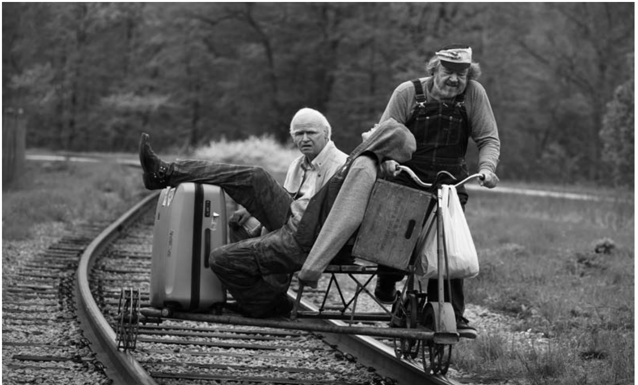
El abuelo que saltó por la ventana

Los cines nórdicos vienen dando muestras de un vigor inusitado en los últimos tiempos, quizás como una especie de compensación por la presión que sus sistemas financieros ejercen sobre el sur europeo y, al mismo tiempo, como peni-