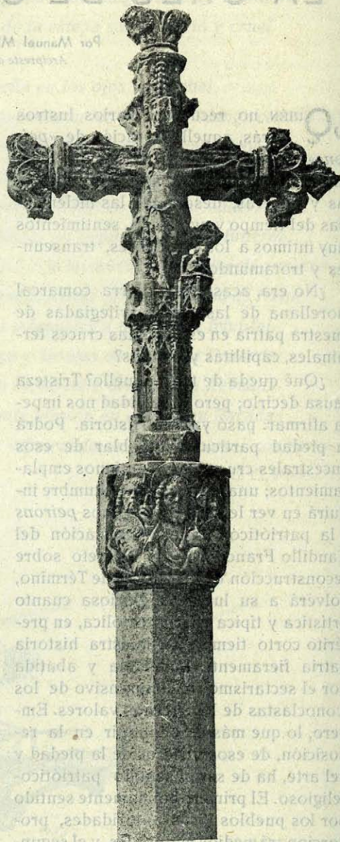
MORELLA.- Cruz terminal de Santa Lluçia.-Anverso.