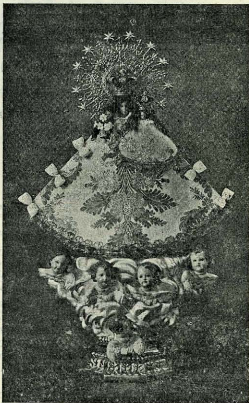
Facsímil de Nuestra Señora de VALLIVANA